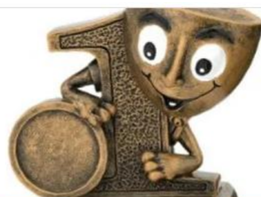
Prijzen voor iedereen