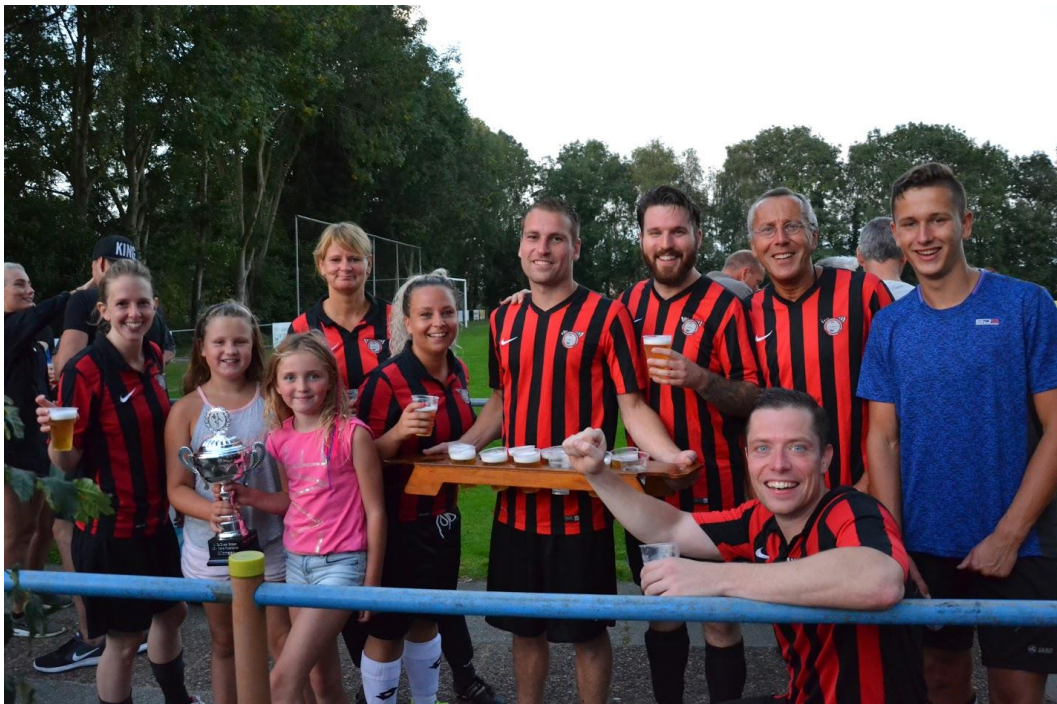
Noordwester – winnaar van het Oranje Poldertoernooi 2017