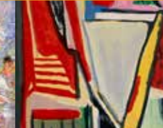
Bram van Velde