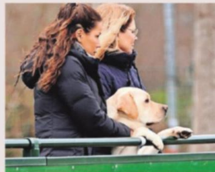
▲ De meegereisde labrador volgt zijn baasje op het veld.