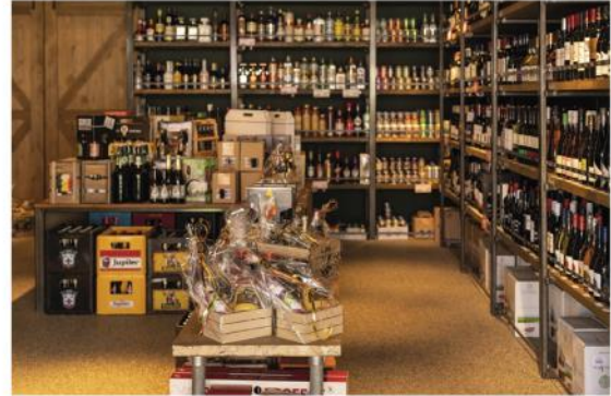
Steervolle slijterij in Woudrichem

Een flesje wijn kun je uiteraard gewoon bij de supermarkt kopen. Maar als je echt op zoek bent naar een goede fles wijn, een ruime keuze wilt hebben en ook nog eens goed wilt worden geadviseerd, dan kun je beter eens binnenlopen bij Slijterij Buiten de Vesting in Woudrichem. "En naast wijn verkopen wij natuurlijk nog ontzettend veel meer", aldus eigenaar Frederik Nouwens.