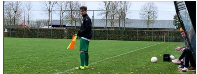
Hé Grens! Hoeveel staat het?

Fijne vakantie allen, en tot volgend seizoen.