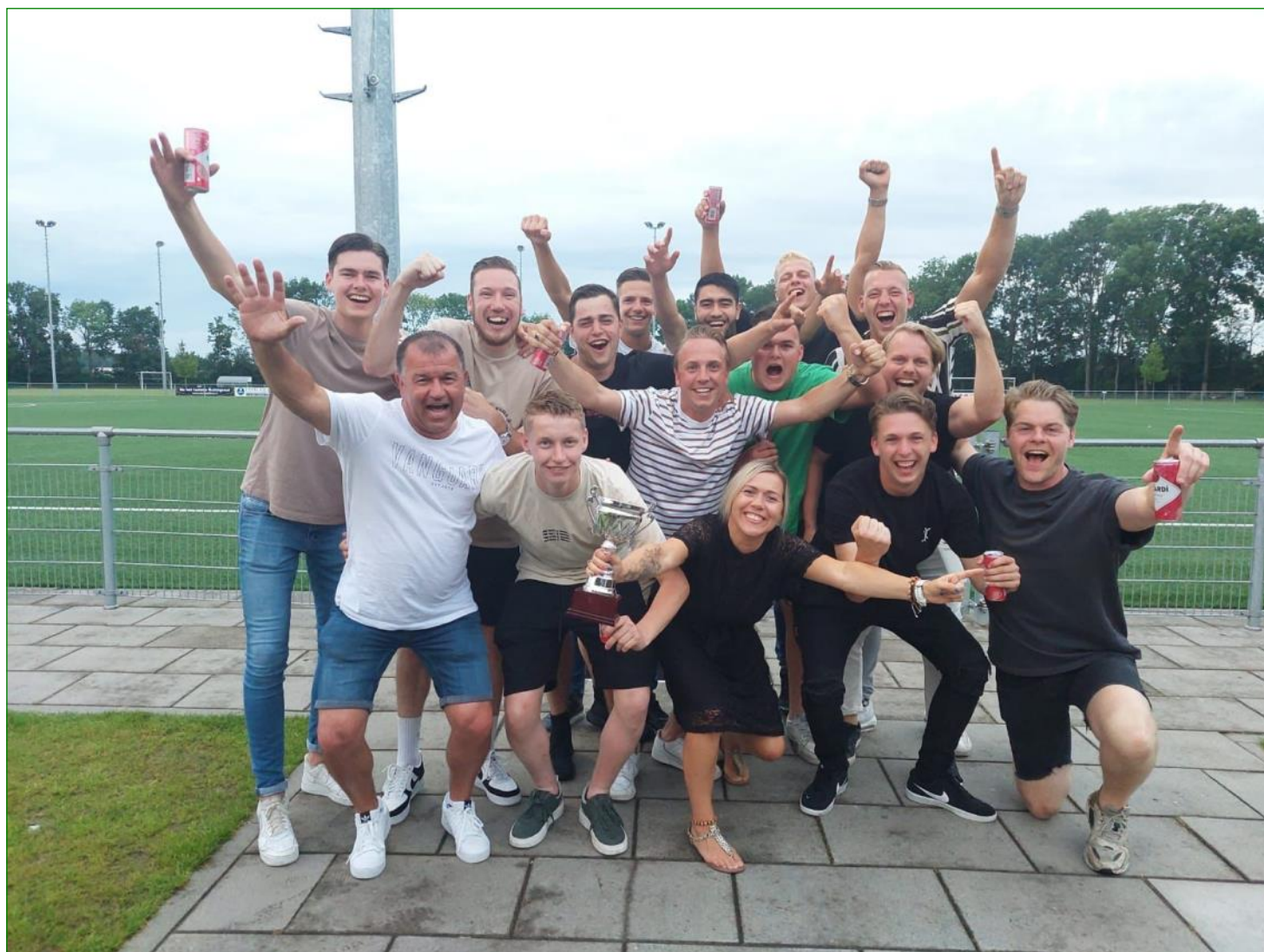
Winnaars afsluitdag seizoen 2021/2022