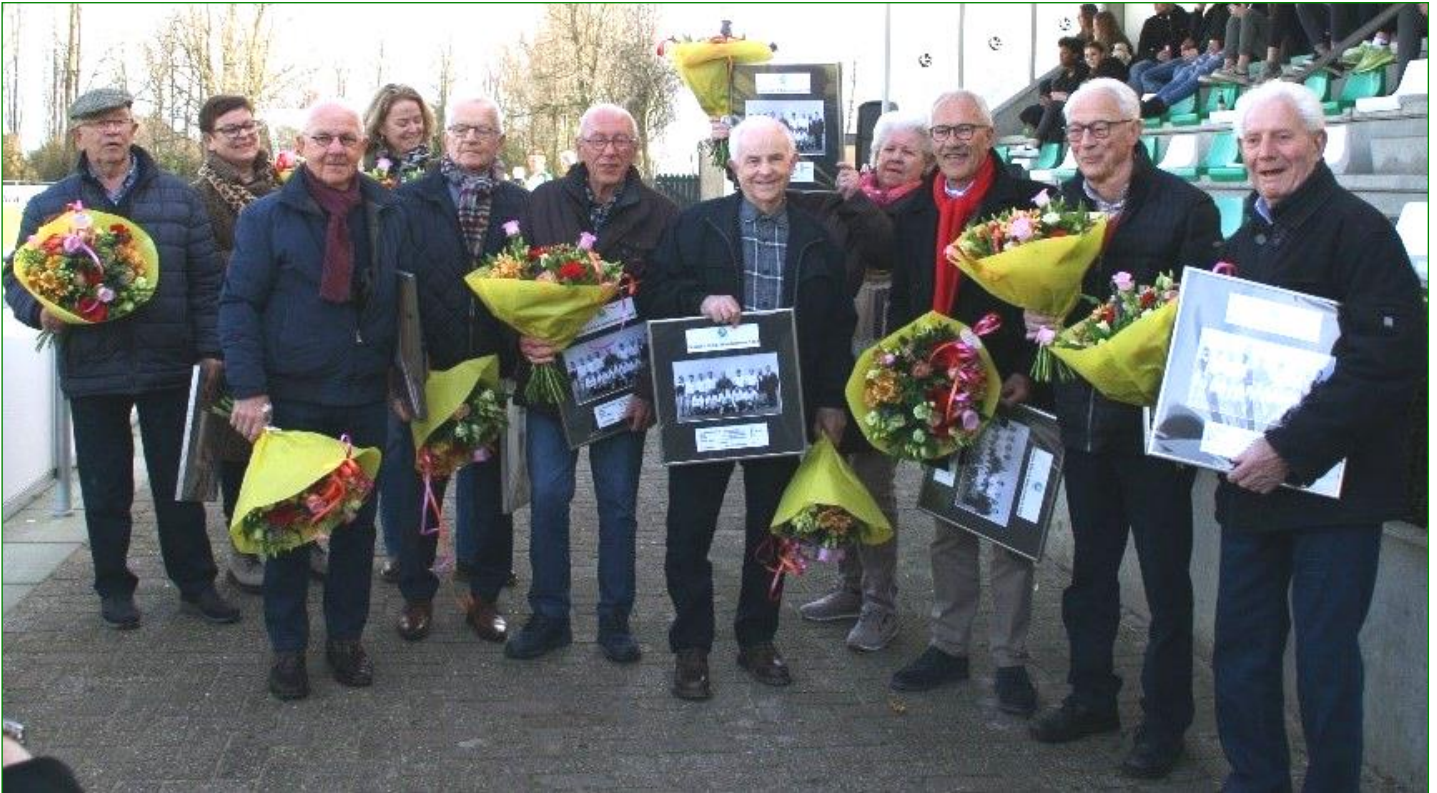
Deel van de finalisten uit 1964

In de rust van de competitiewedstrijd tegen de Zwerver had het bestuur het plan opgevat om één van de hoogtepunten van de vereniging eens extra te belichten. In 1964 behaalde het eerste elftal de finale van de zaterdag bekercompetitie. Een klein lullig bekertje van de KNVB was de prijs. Helaas werd met 4-3 verloren van Huizen, maar de prestatie was groot. Elke speler kreeg later nog een elftalfoto en deze oude foto werd gebruikt op deze feestdag in de vorm van een mooie uitvergroting met de successen van die competitie erop vermeld. De nog in leven zijnde spelers waren op één na allemaal aanwezig. Daarnaast nog de vrouwen van de overleden spelers en de kinderen van de trainer, heel bijzonder. Een