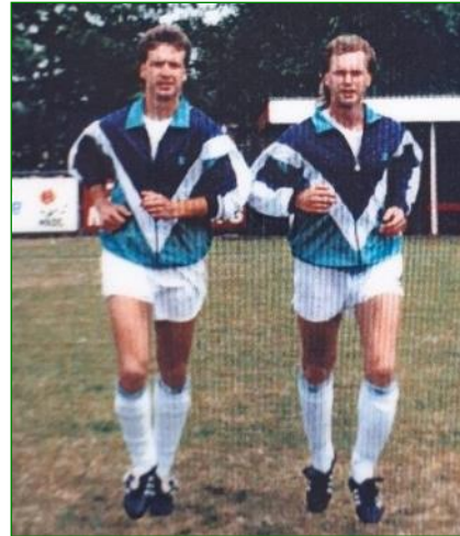
Zelfs trainen deden ze samen