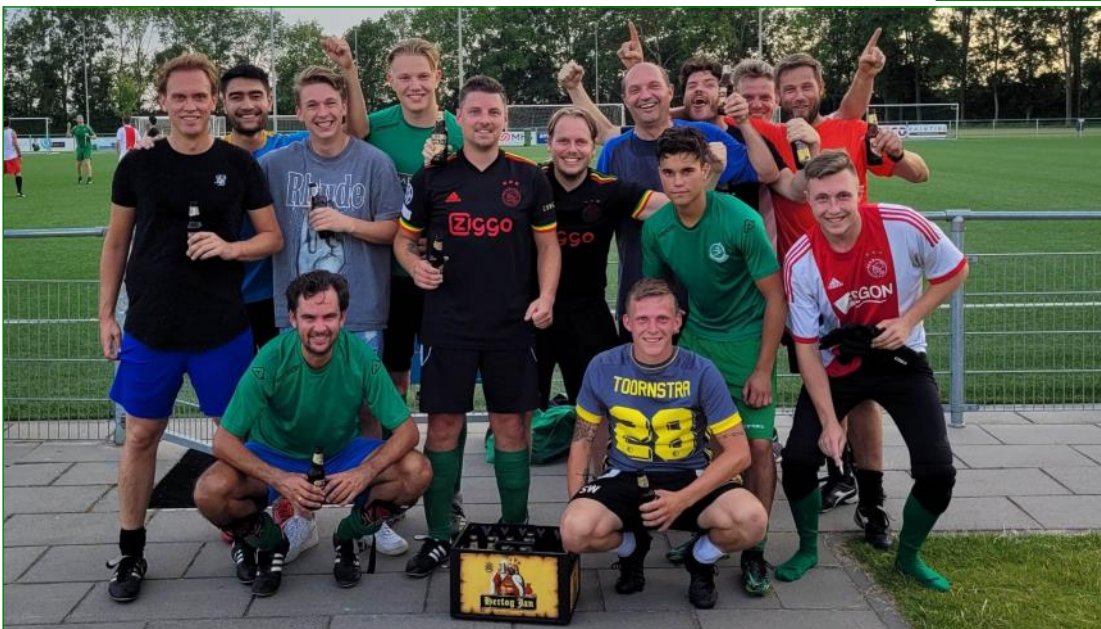
Het winnende team