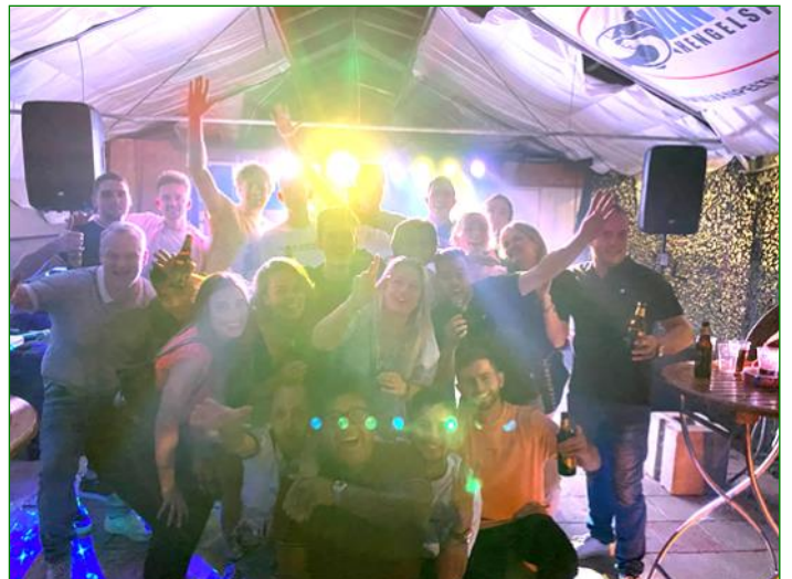
Teamfoto met aanhang