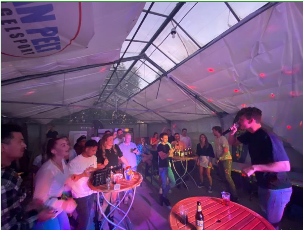
Live optreden van Armani