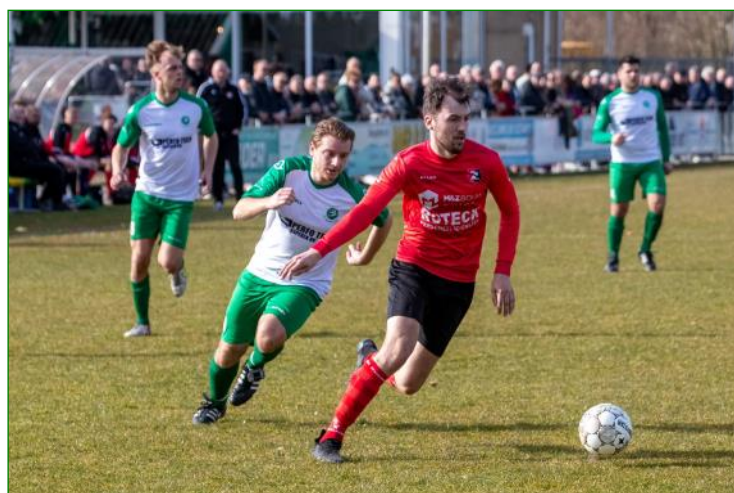
En passant wordt De Zwerver nog even verslagen

De feestdag was compleet met prachtig weer en ook nog eens met 3-0 gewonnen van de Zwerver. Nog lekker nababbelen in de kantine en voor de liefhebbers nog een DJ tot in de late uurtjes. De kinderen van de trainer werden nog laat gesignaleerd. Het bestuur en de club kunnen terugkijken op een mooi en geslaagd jubileumweekend.