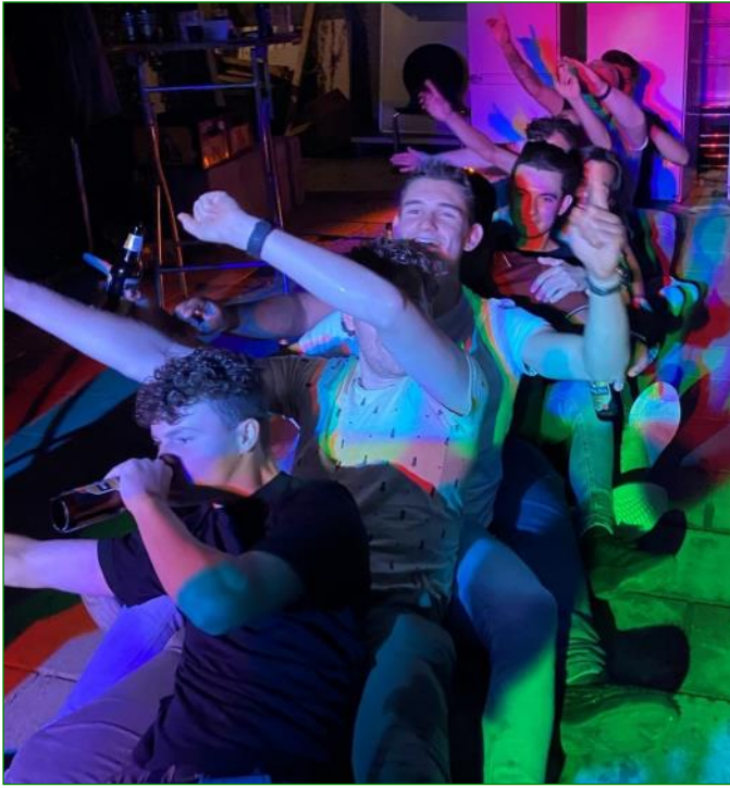
Het 5 e was om half 11 al in staat om te roeien