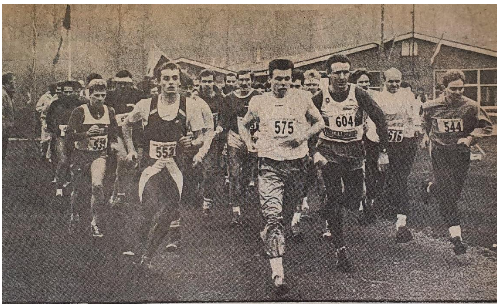
Start 10 km 1 e Winterloop

De naam van de WAF is onlosmakelijk verbonden met de Winterloop. Werd in het begin deze loop hoofdzakelijk nog georganiseerd als winteractiviteit voor de Woudenbergse voetballers later deden omliggende verenigingen en hardloofanaten met de loop In de loop van de jaren is de winterloop uitgegroeid tot een van de beste georganiseerde hardloopevenementen in de regio.