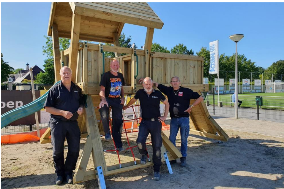
Met vrijwilligers en een bijdrage namens de WAF staat er een mooi speeltoestel

De afgelopen jaren heeft de WAF mogelijk gemaakt dat er verlichting op de velden is, dat de speeltuin er voor de kids prima verzorgt uitziet en zijn er nog veel meer mooie initiatieven mede door de WAF mogelijk geworden.