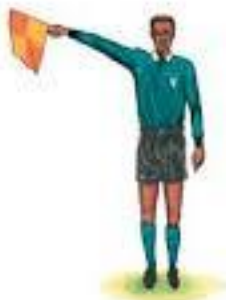
inwerp voor de aanvaller