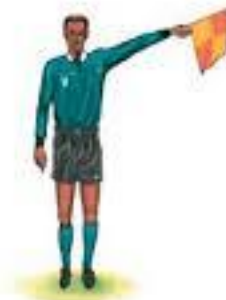
inwerp voor de verdediger