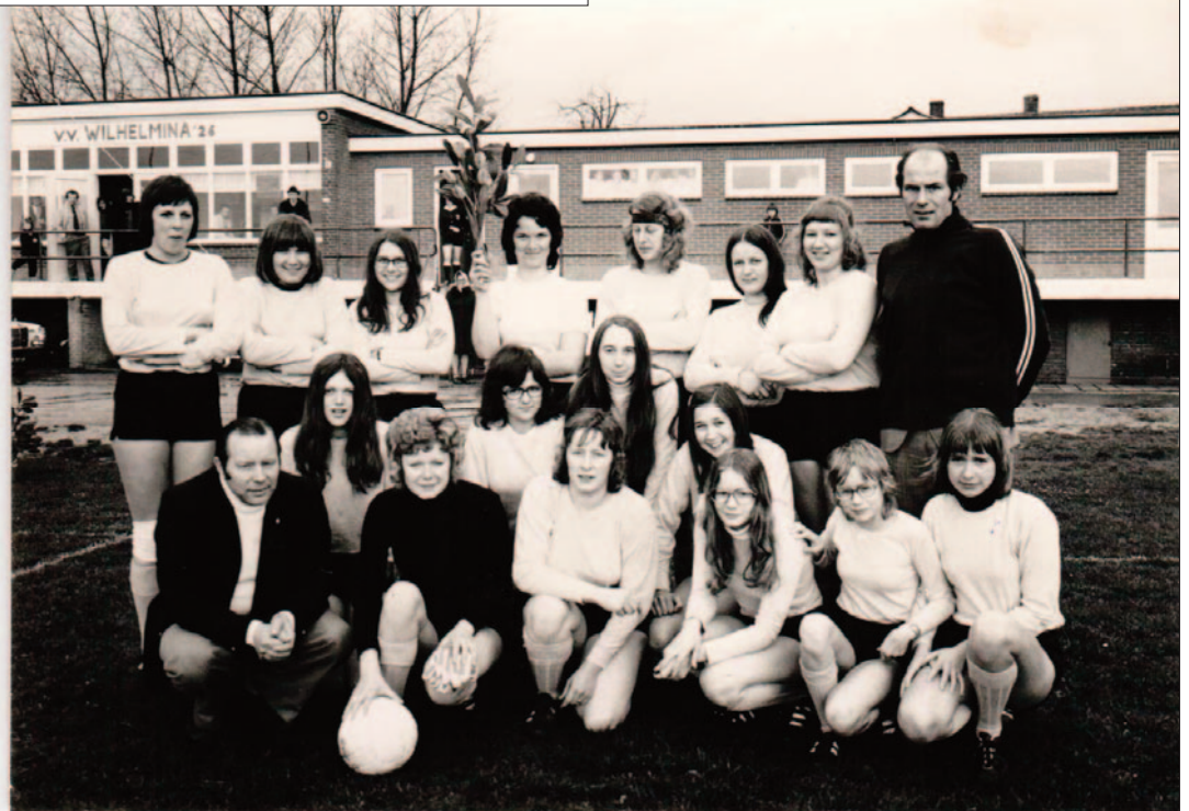
FOTO UIT DE JAREN '70, 1 E VROUWENTEAM.

KRANTENARTIKEL OVER HET VROEGERE 5 E EFLTAL.