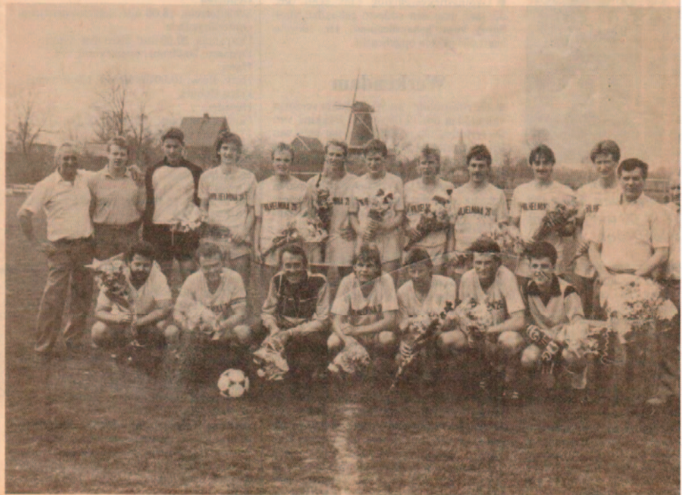
● Wilhelmina wordt komend seizoen namens de gemeente Aalburg de eerste vertegenwoordiger van de tweede klasse KNVB.

Wilhelmina'26 is de vierde club in de streek die de sfeer van de tweede klas mag gaan proeven. Kozakken Boys, Altena en jaren geleden Woudrichem gingen de kanaries voor. (Zie verder de sportpagina)