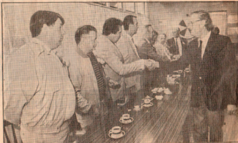
Felicitaties voor het bestuur van het jubilerende Wilhelmina '26 in Wijk en Aalburg.