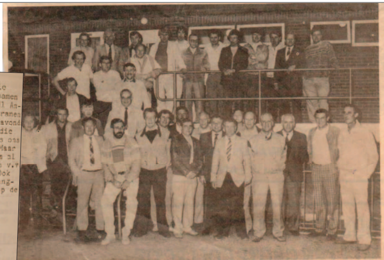
Wilhelmina '26 heeft 38 leden die 25 of meer jaren de club trouw bleven en zes personen die 9 jaar lid zijn van de vereniging. Allen kregen een oorkonde en een pen met inscriptie.