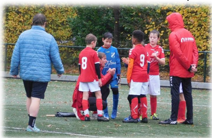
Westerwolde JO10-2 bij een eerdere wedstrijd