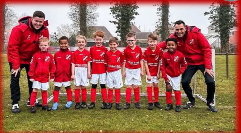
07-03-2026: Westerwolde JO7-1 voor het eerst actief