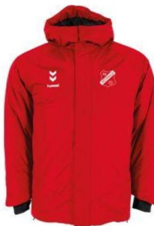
Hummel Padded Coach Jacket

bestellen kan via info@vwwesterwolde.nl o.v.v. naam, artikel, maat en aantal