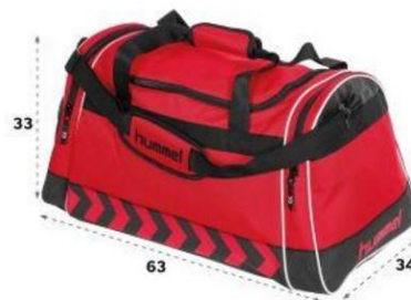
Hummel Luton Bag