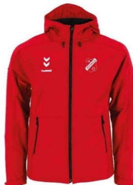
Hummel Softshell Jacket

voor alle artikelen met clublogo + € 5,00 met initialen + € 5,00 met naam + € 6,00