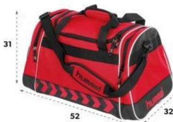
Hummel Milford Bag