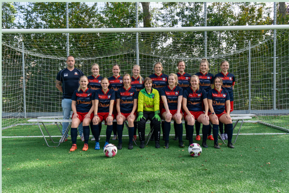
ST WWS/Warga VR1

* Aanvangstijd thuiswedstrijden om 12:30 uur;