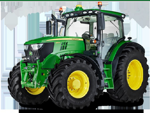
DE NIJSTE 6 R SERIE FAN JOHN DEERE IN BOPPELACH LMB TH. ZWART B.V. WERGEA 058-2551201