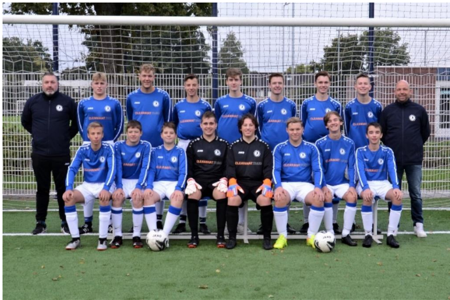
SC Valburg 2