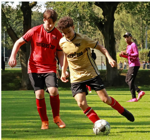
Uit- en thuiskeeping VDZ-jeugd (VDZ JO15-4 vs JO15-5)