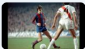
Johan Cruyff - The Impossible is Nothing youtube.com