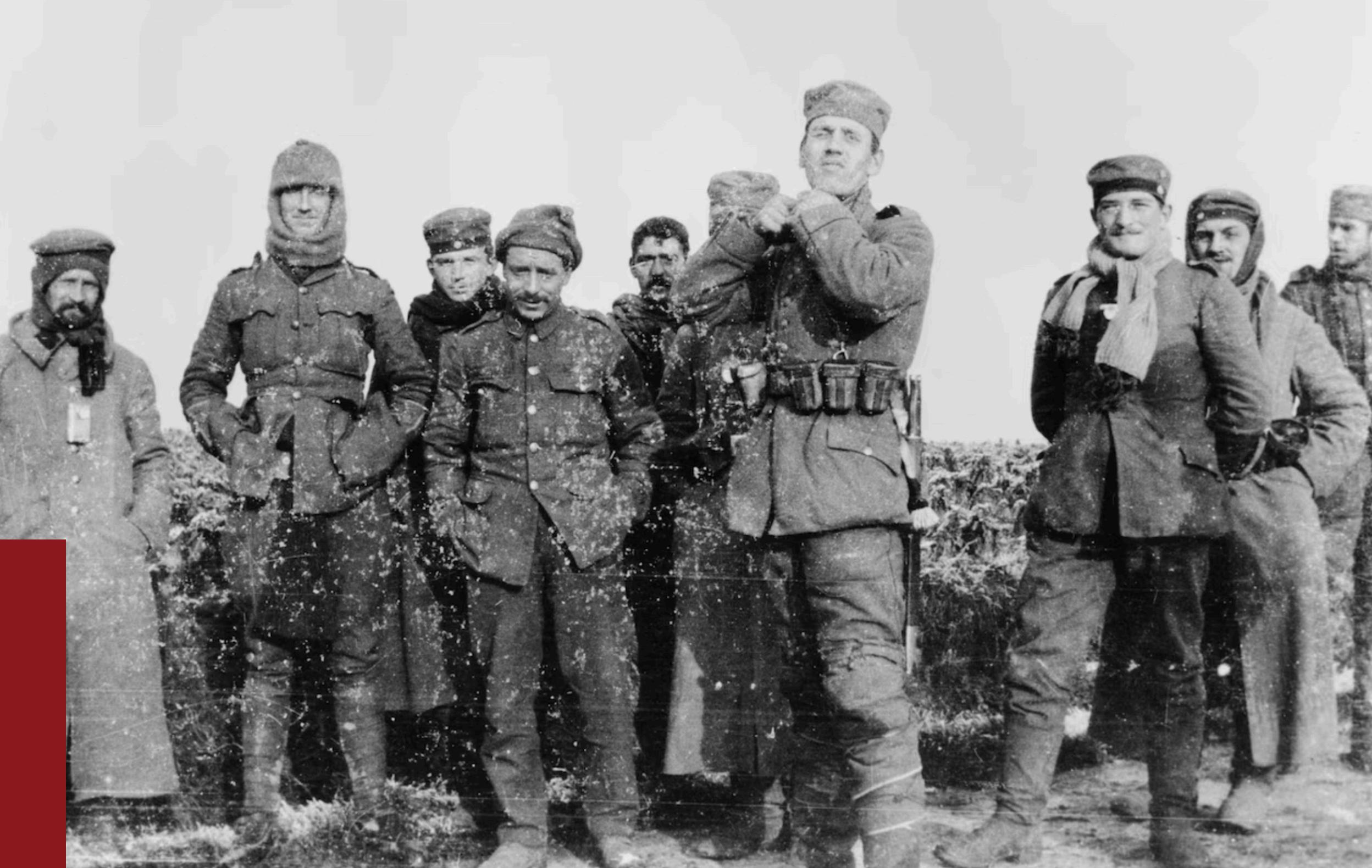
Duitse en Britse soldaten op niemandsland, Kerstmis 1914.