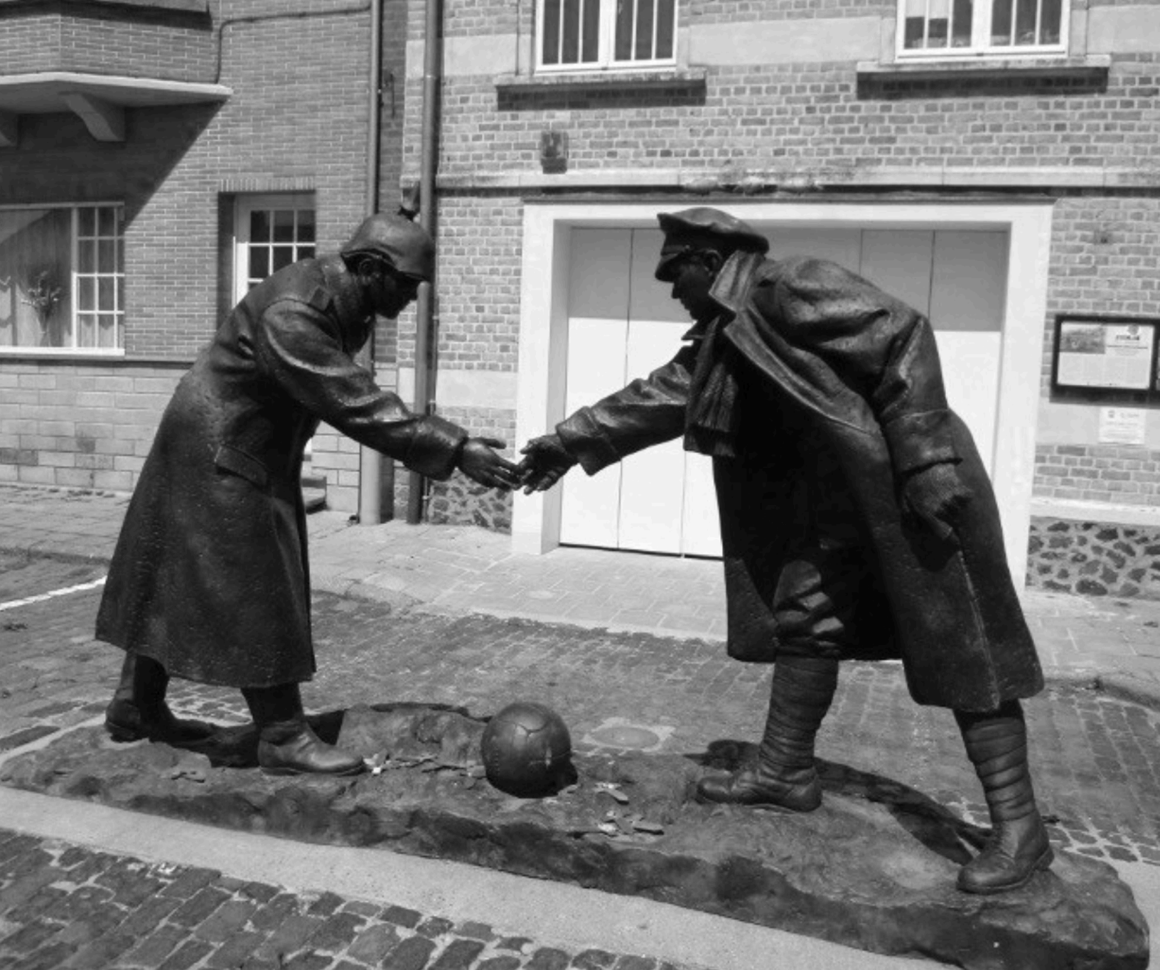
Duitse en Britse soldaten op niemandsland, Kerstmis 1914.

Naast een militaire begraafplaats in de gemeente Komen-Waasten zijn twee loopgraven nagebouwd om bezoekers een indruk te geven van de erbarmelijke omstandigheden van toen.