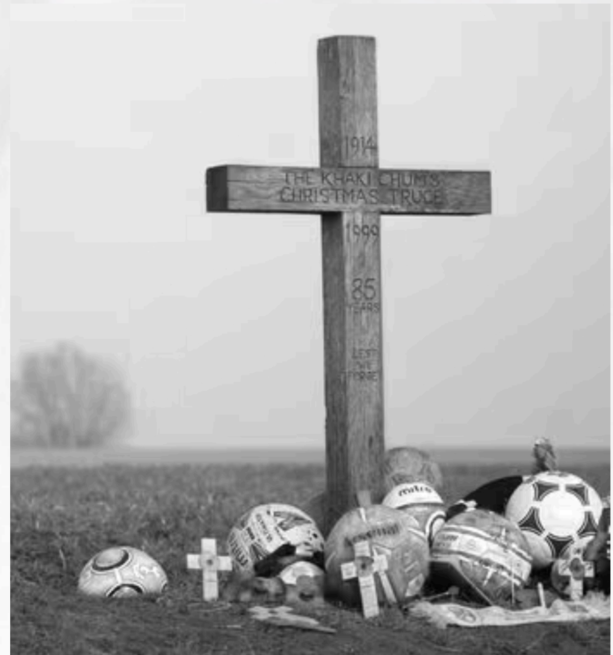
Een eenvoudig houten kruis markeert dit historisch moment.

Zij eerden de gesneuvelde soldaten, met name voormalige voetbal- en rugby-internationals die nabij Passendale zijn begraven.