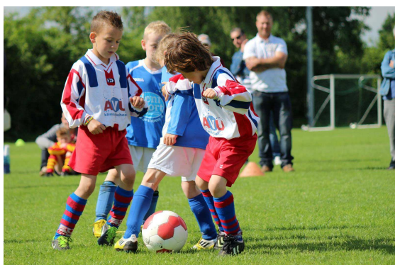
Boefjestoernooi: de strijd is begonnen....