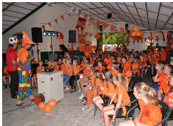
Pupillenkamp: Samen WK 2014 kijken