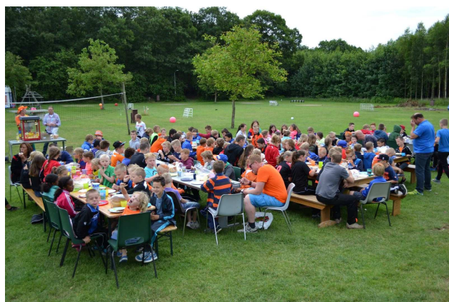
Pupillenkamp: samen ontbijten