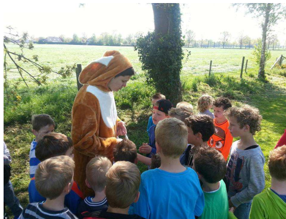
De Paashaas telt de eieren