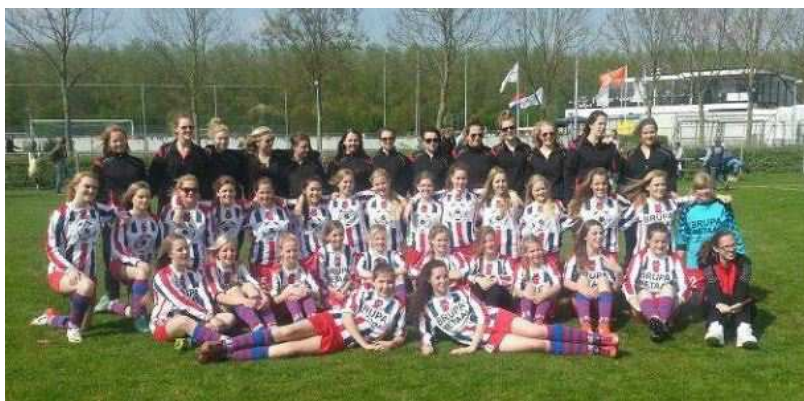
De deelnemende meiden aan de "Hollands Girls Cup" in Almere