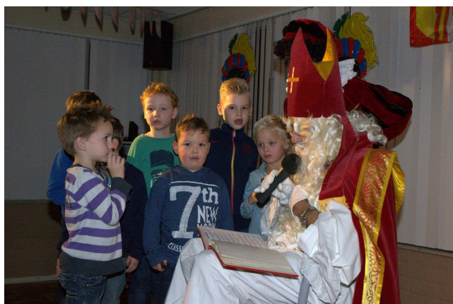
Sinterklaas is op bezoek