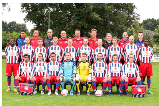
UB 1 seizoen 2013-2014