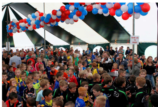
Boefjestoernooi: Prijsuitreiking in de feesttent