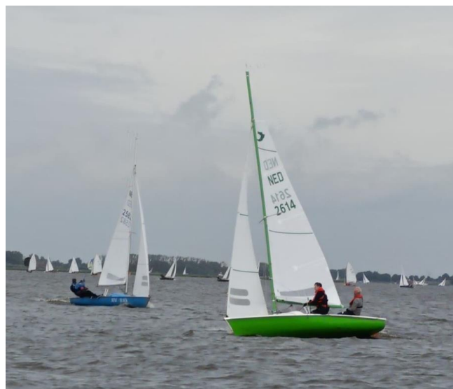
↑ De Vliegende Brabander gaat er vandoor.... ↑SeeYaa in mooi groen.