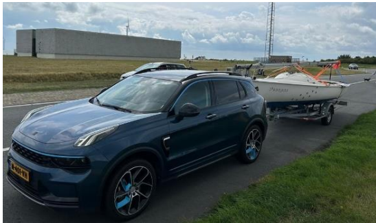
Kingfisher Rolf Deen is er ook klaar voor! >

Opmerkelijke spullen die óók meegaan: Vouwfiets, Parasol, Buitenboordmotor (plus mengsmering benzine en motorsteun), en een extra grote tafel.