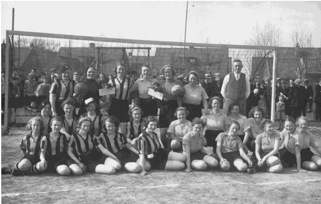
Damesvoetbal ter gelegenheid van het door de mannen behaalde kampioenschap in 1935