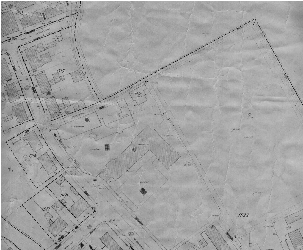
Situatie rond de Schoolstraat in 1972 met 1. plaats waar tot 1953 het voetbalveld was, 2. het voetbalveld van 1953 tot 1980, 3. het kleedlokaal en de ernaast gelegen kantine, 4. de lagere school en 5. het verenigingsgebouw

Hoe anders zou het met het bij de opening veel geprezen nieuwe veld aflopen, want men beschikte nu wel over een nieuw veld, maar uit de brand zou de vereniging nog lang niet zijn, de staat van het veld bleek namelijk een voortdurende bron van ergernis. De jeugd voetbalt steeds in de vroege avonduren op het veld, wat de doelgebieden geen goed doet. Men besluit na een vergadering dan ook om het veld af te sluiten en graszoden aan te schaffen om de opgelopen schade aan de doelgebieden te repareren. De algehele staat van het veld is vanaf het begin niet goed geweest, er moest veel worden geprikt omdat de bovenlaag dicht zat, veel opbrengen van zand, aldus een deskundig advies, het hielp allemaal maar weinig, waardoor er veel afgelastingen waren. Eind 1958 ontstond de gedachte om tot de bouw van een nieuwe kleedgelegenheden te komen. De toenmalige trainer Frans Kater uitte ook de wens om een