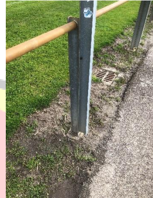
Figuur 3 Detail koppeling staander

Dit is door de onderhoudsploeg borden een keer gecorrigeerd. Doordat de ipe profielen slechts in de klei staan is het de verwachting dat in de loop der jaren mogelijk opnieuw een correctie gedaan moet worden op de rechtstand.