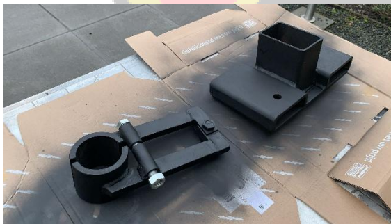
Figuur 9 Hulpstukken

Aan de onderzijde is een geleider aangebracht en aan de bovenzijde een hoedje dat over het profiel past. Zie voor hulpstukken figuur 8.