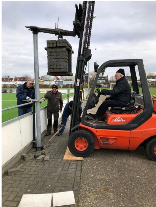
Figuur 7 vorkheftruck

Uitvoeringstechnisch is dit nog best een uitdaging, want hoe krijg je dat profiel een meter in de grond. In het begin staat het profiel 4 m boven de grond, hoe komt je daar boven bij en hoe krijg je dat profiel in de grond. Hier is speciaal materieel nodig. Hiervoor is de hulp ingeroepen van kraanbedrijf TUK. De huidige eigenaar John Tuk is ook een