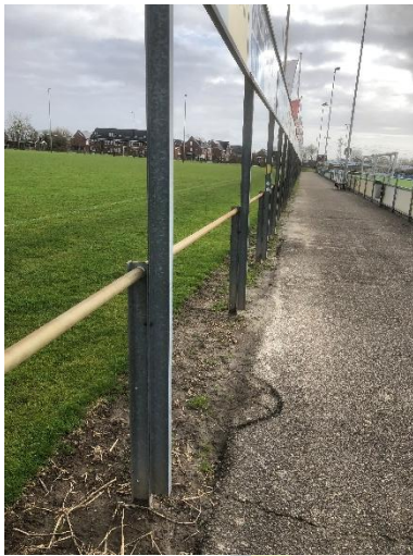
Figuur 4 2de ring lange zijde

Nadat al enige jaren de ruimte rondom het veld vol gezet was met borden is besloten op de lange zijde aan de kant van het 2 de veld een 2 de ring te plaatsen. Deze borden zijn