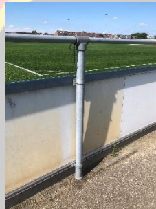
Figuur 2 Ophanging nieuw