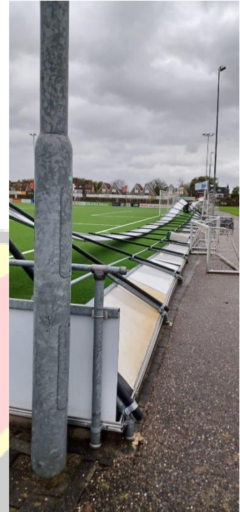
Figuur 5 Resultaat storm

De buizen van de korte zijde stonden opgesloten tussen het asfalt of de klinkers van de bestrating. Ten eerste was dit de bestaande situatie en bewust gekozen om scheefstand zoals bij de lange zijde te voorkomen. Echter alle wind moet door de oorspronkelijke buizen worden weerstaan waarbij ook de lage borden meetellen in de belasting. Het gevolg was dus dat de buizen allemaal geplooid waren en plat lagen. Zie figuur 5 en 6.