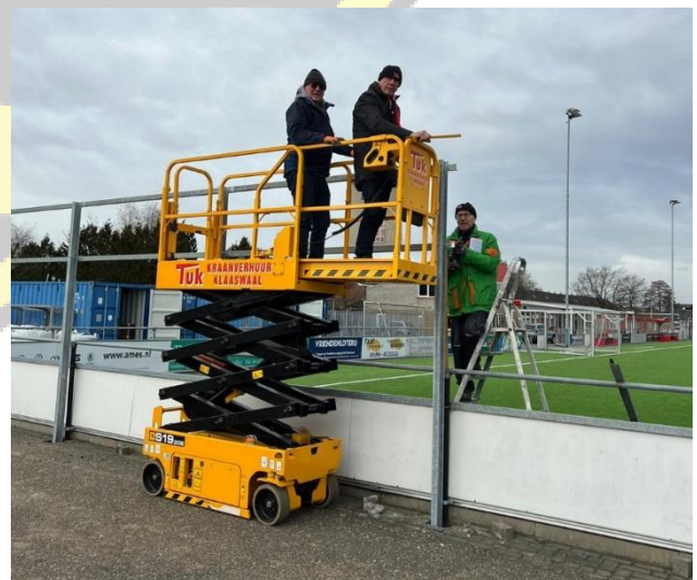
Figuur 8 hoogwerker