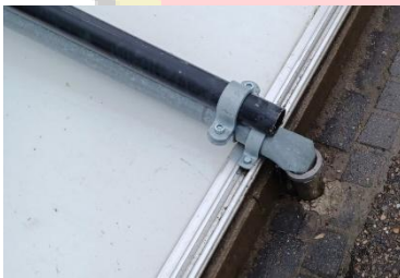
Figuur 6 plooiën buis

Soms zit het mee en soms zit het tegen. Er moest een nieuw plan gemaakt worden.