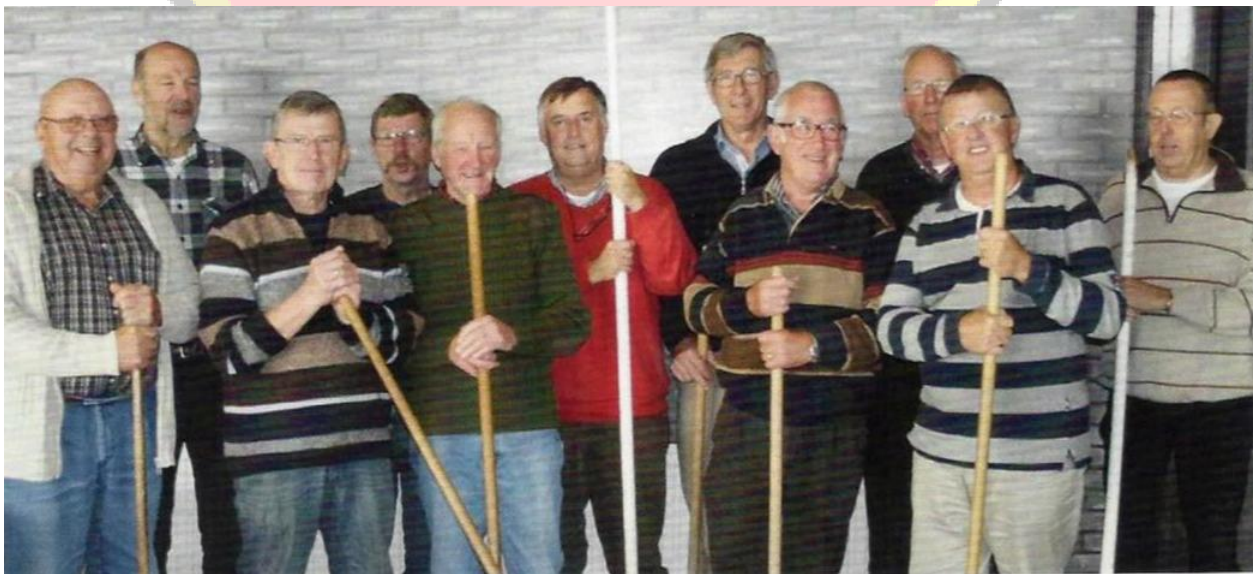
Onderhoudsploeg SSS 2014

SSS heeft op meerdere plaatsen commissies van diverse onderdelen. Een daarvan is de schoonmaak - onderhoudsploeg. Bij toeval kwam een foto tevoorschijn met daarop een compilatie van activiteiten die door de toenmalige onderhoudsploeg werden uitgevoerd. De foto zoals hier weergegeven is van het jaartal 2014.