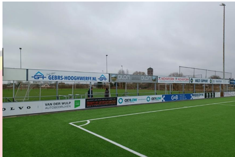
Figuur 10 Eindresultaat 2de ring korte zijde

Nadat alle staanders zijn geplaatst is het tijd voor de horizontale regels, de onderregel en de bovenregel. Omdat dit zich op +3,0 m boven de grond plaats vindt is er gebruik gemaakt van de schaar hoogwerker van TUK, zie figuur 9. Tenslotte het fraaie eindresultaat van de 2 de ring korte zijde.