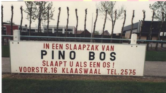
Figuur 1 Reclamebord oud.

De constructie bestaat uit 2 verschillende methoden. Hoofdzakelijk zijn de borden rondom het veld bevestigd aan de omheining van het veld. In het verleden gebeurde dit aan de betonnen afrasteringspalen, zie foto 1. Bij de aanleg van het kunstgrasveld is de omheining ook vernieuwd en daarbij ook de ophanging van de borden, foto 2. De constructie is zodanig dat een willekeurig bord eruit gewipt kan worden of erin gezet zonder de naast staande borden weg te moeten halen.