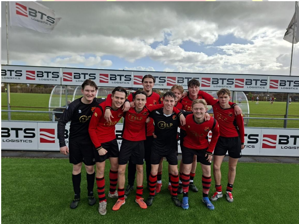
De mannen van SSS JO19 staan te trappelen om de stap naar de senioren te maken

SSS kijkt dan ook met veel vertrouwen en enthousiasme uit naar het nieuwe seizoen. Samen bouwen we verder aan de toekomst!