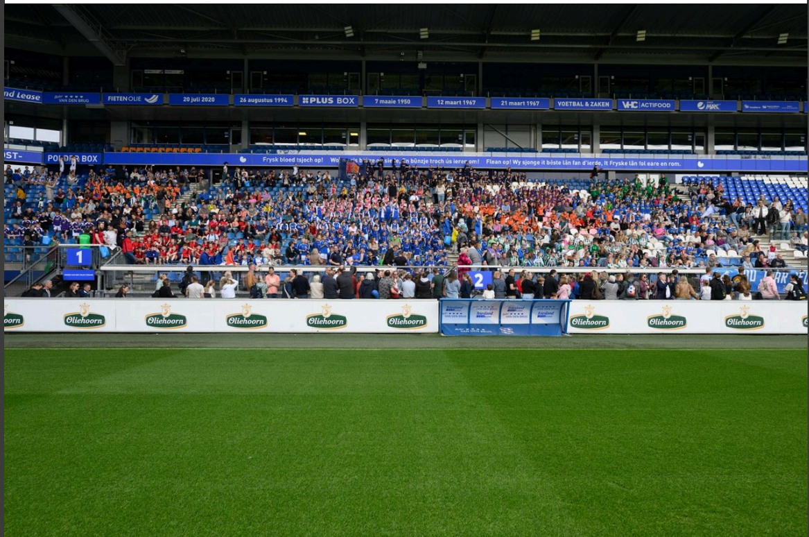
Vrijwilligersavond v.v. Read Swart