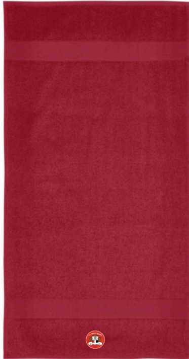
Handdoek € 13,-