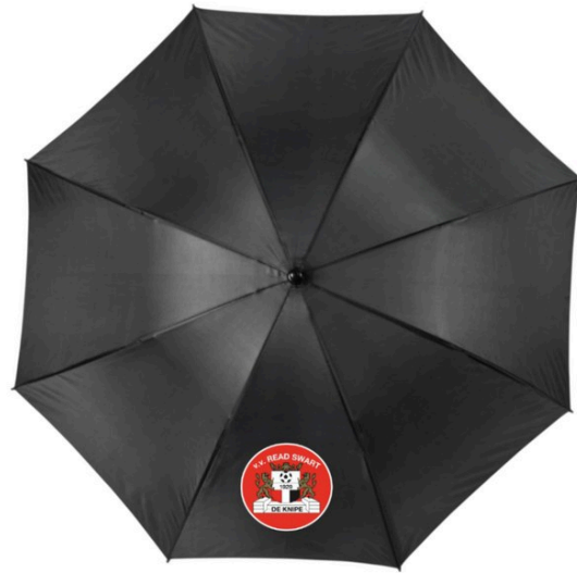
Paraplu € 18,-