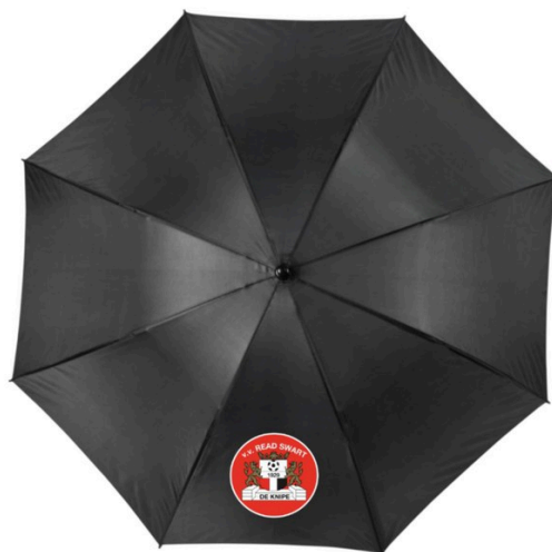
Paraplu € 18,-