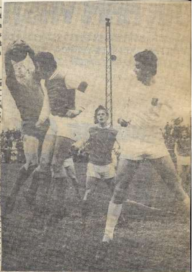
ZIEUWENT — De doelman van Grol plukt de bal weg boven het hoofd van de aanvoerder van RKZVC, tijdens het duel dat beide ploegen gisteren in Zieuwent uitvochten. Ten aan-

Nooit eerder werd een amateurwedstrijd in de Achterhoek door zoveel toeschouwers bezocht. Zeer waarschijnlijk hebben niet alle zeventuizend toeschouwers de strijd volledig kunnen volgen. De voetbalenthousiasten stonden op sommige plaatsen vijf rijden dicht achter de lijnen. Honderden hadden echter een riante plaats gevonden op de zeven platte boerenwagens die het bestuur van de Zieuwentse club rond het veld had gezet.