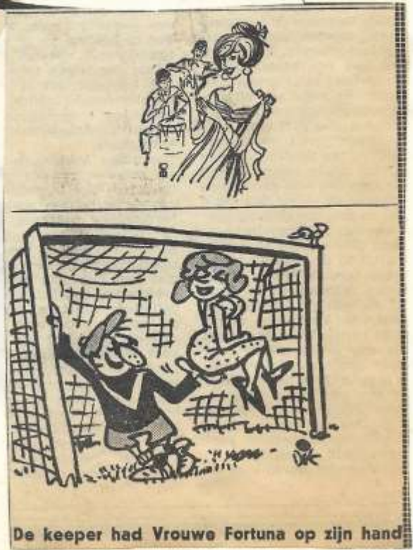
De keeper had Vrouwe Fortuna op zijn hand

Dubbel feest in GROENLO ZONDAG EN GROEL KAMPIOEN? MAANDAG MEIMARKT tevens