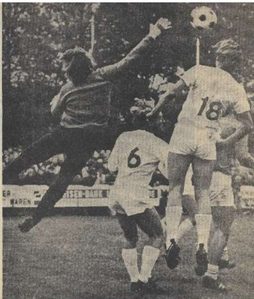
Werk aan de winkel is er zondag ongetwijfeld weer voor de RKZVC-defensie (hier in actie tegen Lonsa)