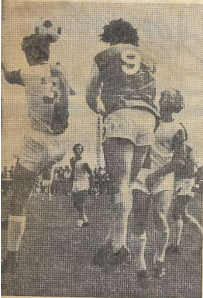
De Zieuwentse defensie bezweert het gevaar. Oosterveld (9) krijgt geen kans.

DOESBURG-ZIEUWENT — De Graafschap heeft het afgelopen weekeinde de reeks van oefenwedstrijden ter voorbereiding op de competitie niet al te productief afgesloten. Tweedeklasser sportclub Doesburg werd nog wel op een redelijke afstand gezet (5-0), maar tegen de Zieuwentse vierdeklasser werd slechts drie maal de roos vol getroffen. De geringe schotvaardigheid in Zieuwent is niet alleen verklaarbaar aan de hand van het feit, dat de RKZVC-afweer in een voortreffelijke vorm stak. Een meer voor de hand liggende oorzaak is, dat de Doetinchemse ploeg opereerde met een min of meer experimentele opstelling.