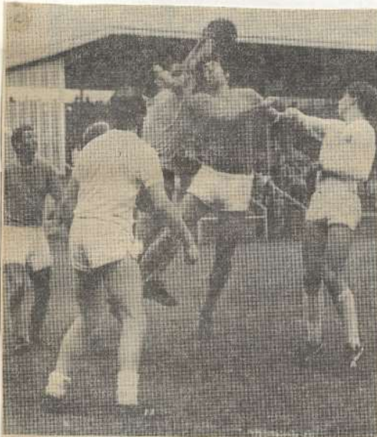
● RKZVC-EMST 7-4: Aanval van RKZVC op het Ernst-doel.

Ondanks de hevige regenval waren er toch nog 750 toeschouwers. De stand in de kampioenscompetitie is thans: RKZVC 3 gesp. 4 pnt.; DVV 3 resp. 3 pnt.; Ernst 4 gesp. 3 pnt. Ernst is uitgespeeld en derhalve uitgeschakeld voor de titel.