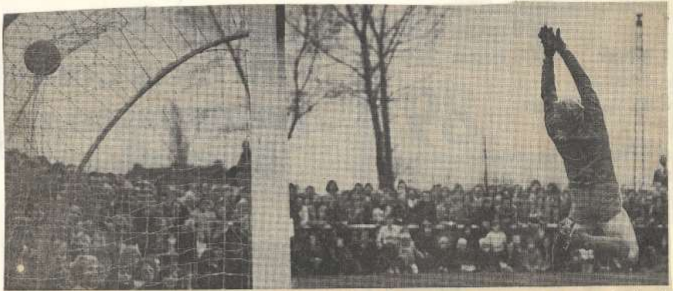
★ De Grol-keeper is kansloos. Tot ontzetting van de duizenden op platte landbouwwagens staande Grol-supporters heeft het zwiepende schoi van Kemkens doel getroffen.