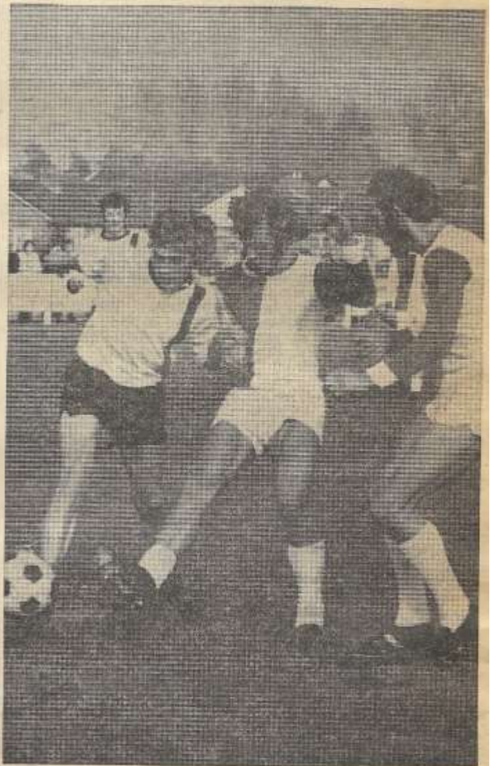
RKZVC-Varsseveld 2-0 — Met grote inzet hebben beide ploegen gestreden. Vooral in de tweede helft strandde menige ZVC-aanval op de hechte Varsseveld-defensie.