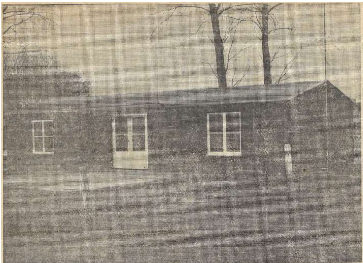
De huidige kleedaccommodatie van RKZVC. Totaal ongeschikt volgens de KNVB, maar ook volgens de voetbalclub zelf.