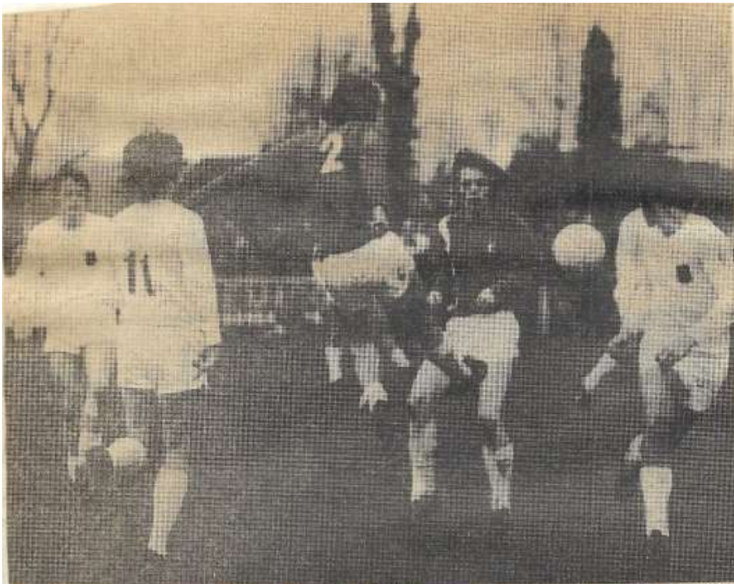
Deze Longa-aanval wordt door de hechte ZVC-defensie op vakkundige wijze onschadelijk gemaakt.