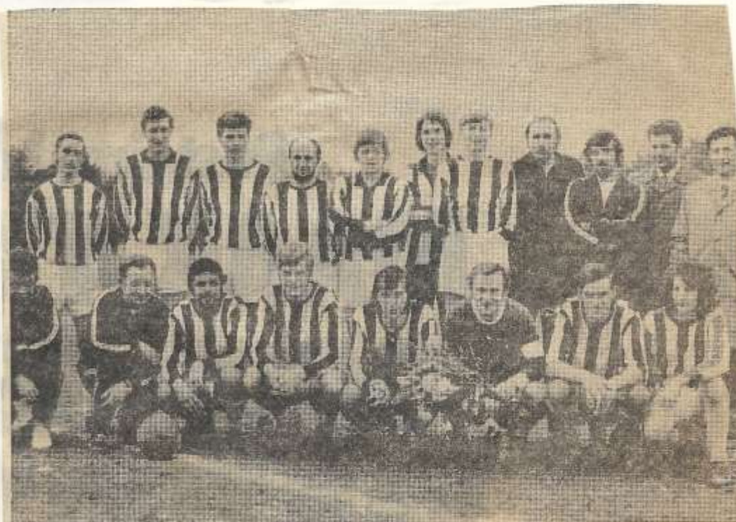
SILVOLDE weer derde klasser! Vrij constant heeft de Silvoldse ploeg zich naar het kampioenschap van de vierde klasse C gespeeld. Het kampioensfeest kwam wat vlug, omdat Varsseveld het tegen ZVC liet afweten.