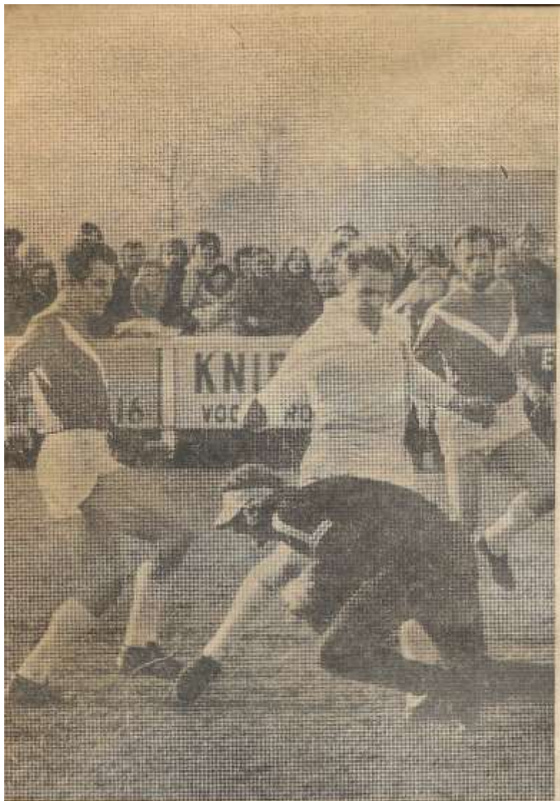
Hoe spannend het toeging in de derby RKZVC-Longa (2-2) blijkt wel uit deze foto. De Longa-doelman grijpt hier goed in.