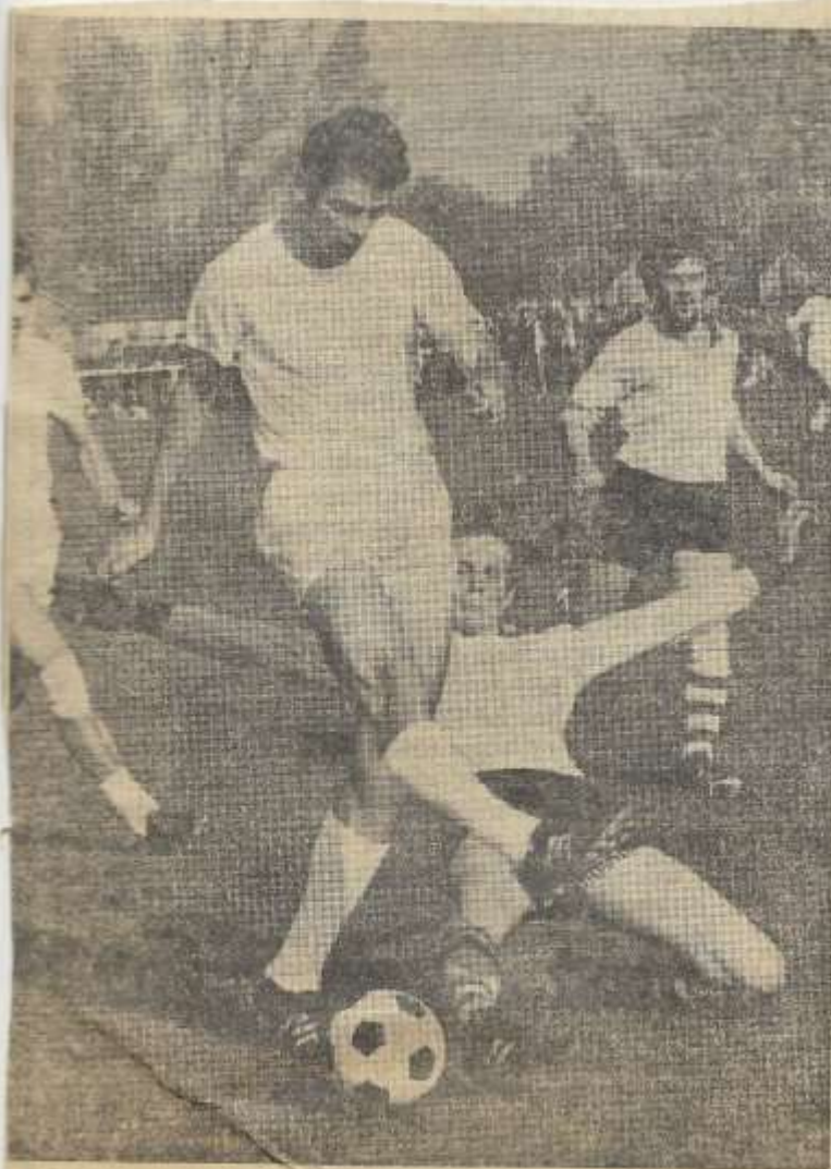
RKZVC-VIOS B — Een aantal van de thuisclub, die onderschept werd.

Overigens waren er niet minder dan ca. 1.500 toeschouwers in Zieuwent. Een aantal waar bij van belaste voetbalclubs RKZVC's penningmeester om zouden benijden.