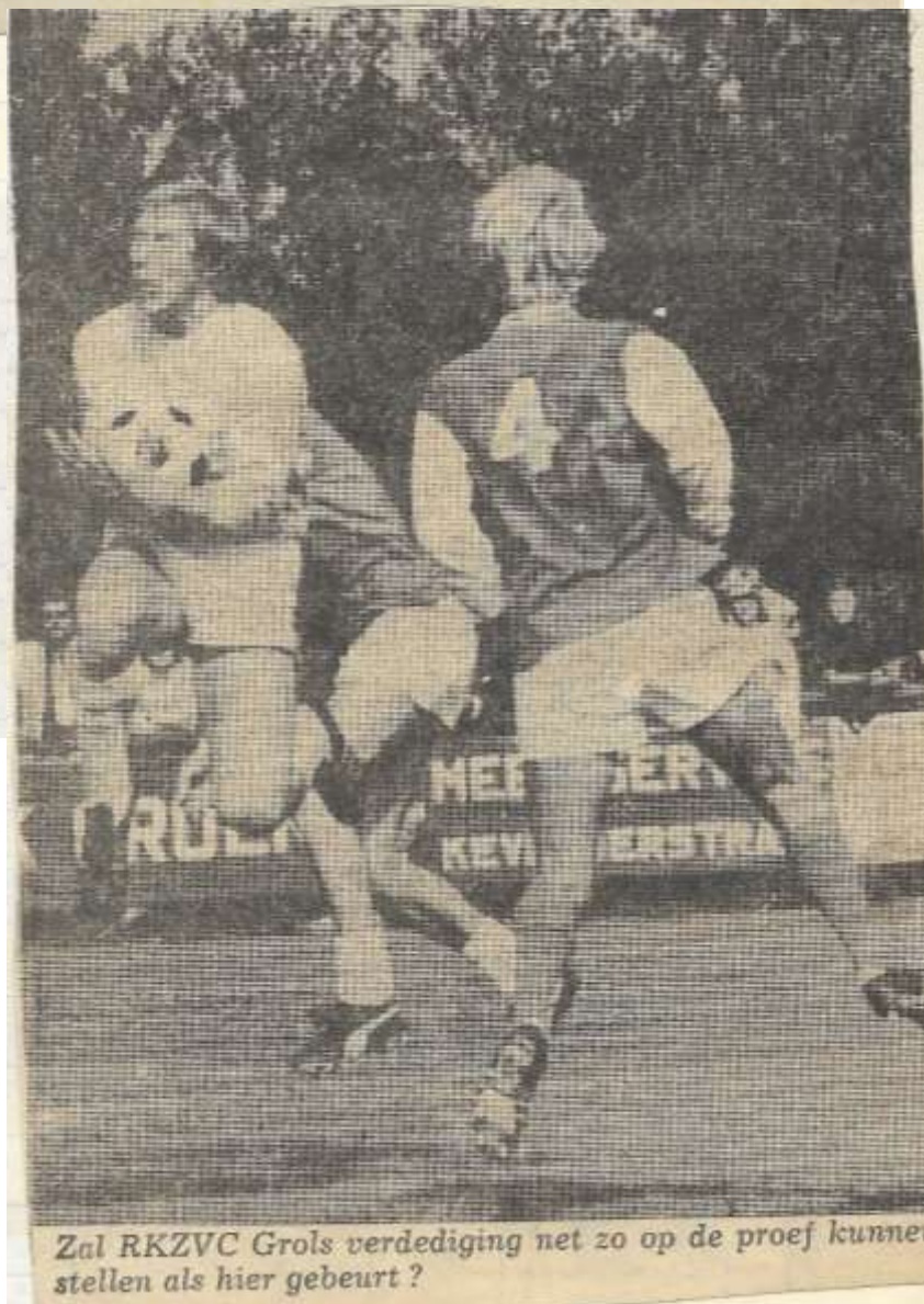
Zal RKZVC Grols verdediging net zo op de proef kunnen stellen als hier gebeurt?

De strijd in 4C is overigens nog bij lange na niet gestreden. Ploegen als Eibergen,