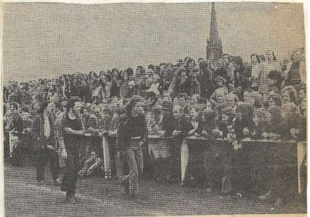
De publieke belangstelling voor de wedstrijd RKZVC-Grol in Zieuwent was enorm. De schattingen lopen uiteen van 6000 tot 8000 bezoekers.

Het duel moest enige tijd onderbroken worden omdat de goed leidende arbiter G. v. d. Kerkhof uit Hengelo zich wegens een blessure moest laten behandelen door een verzorger van RKZVC. v. d. Kerkhof werd deze middag door twee neutrale grensrechters terzijde gestaan. Alhoewel er bijzonder veel op het spel stond had de strijd een sportief verloop.