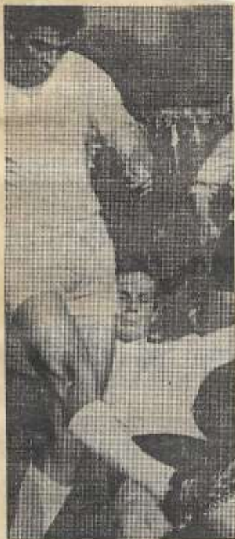
Klein Zeggelink, ZVC's gevaarlijkste man.

R.K.Z.V.C. 2 deed niet onder voor haar grote broer en won met 3-1 van Ruurlo 2.