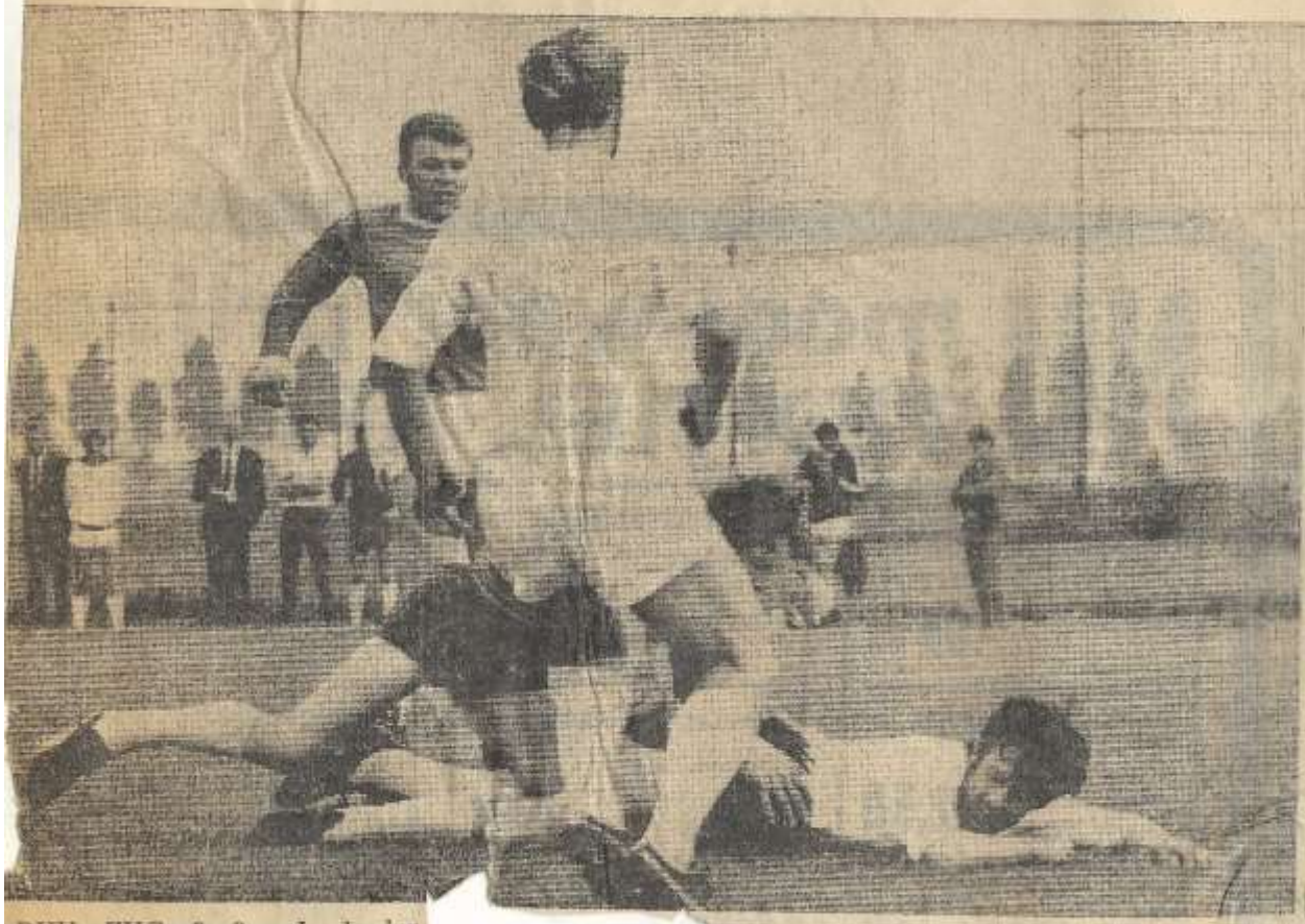
DVV—ZVC: 3—3 — In de dertigste minuut vielen de keeper en een van zijn verdedigers over de bal. DVV vroeg om een strafschop, maar die werd door de scheidsrechter geweigerd.

DUIVEN-DVV en RKZVC uit Zieuwent hebben een gelijkspel behaald in het kampioenschap van de afdeling Gelderland. Het is een gelijk opgaande wedstrijd geworden, waarin de Duivense ploeg voor de rust de beste papieren had en ZVC daarna. De uitslag werd 3—3.