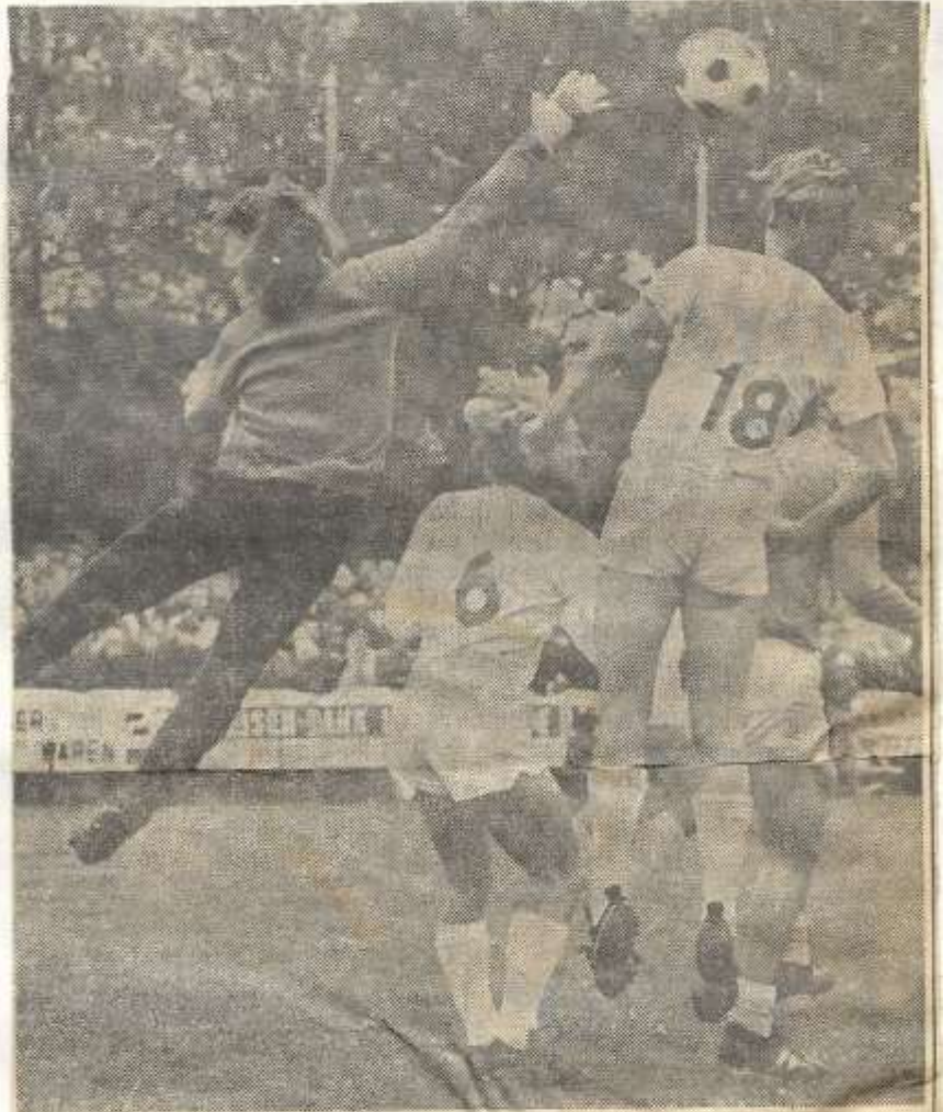
LONGA-RKZVC 1-1 — De Zieuwentse keeper hier volop in actie.

Longa-RKZVC is de onbetwiste top-per in de vierde klas C. We durven ons niet aan een prognose te wagen. Silvalde moet Ajax B. niet onderschatten. Varsseveld komt in Groenlo zelden tot een positief resultaat. Misschien lukt het de zart-witten, die met voorsprong aan de kop gaan, dit keer wel.