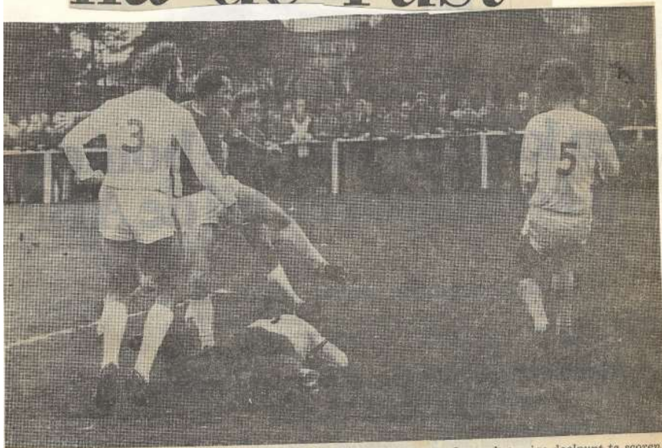
Een scrimmage voor het ZVC-doel: uiteindelijk lukt het Waalders om voor Longa het enige doelpunt te scoren.

4C Etten-Terborg 1-1 (gestaakt) Sp. Neede-Varsev. 4-1