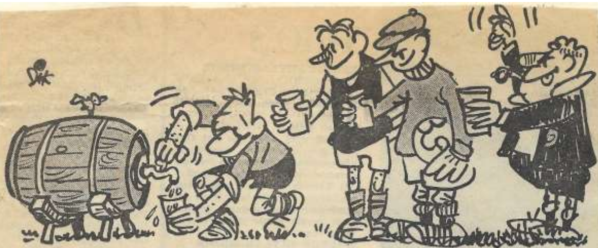
Na de rust werd uit een Grolsch vaatje getapt