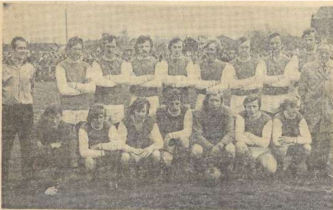
De formatie van Grol die beslag legde op de titel en de daaraan verbonden promotie naar de derde klasse.