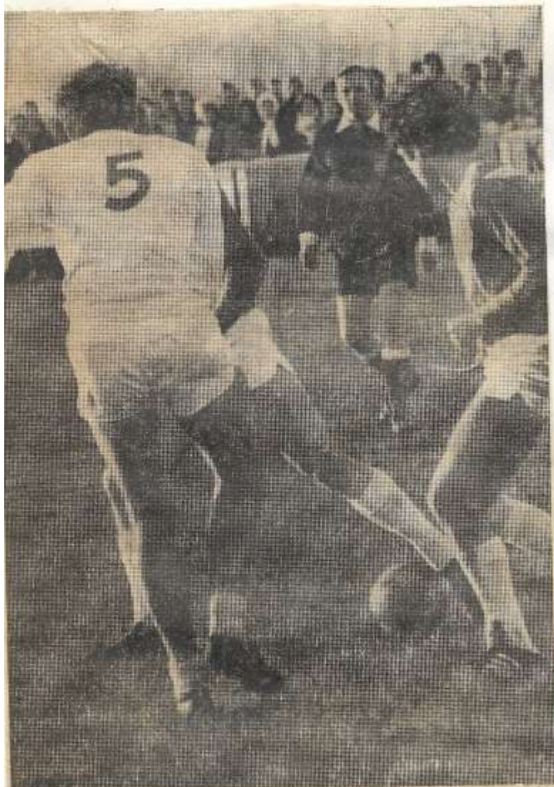
„Scheidsrechters komen we altijd tekort“

Veenhuis (35e min.) en Notten (40e min.) maakten daar gebruik van (1-3).