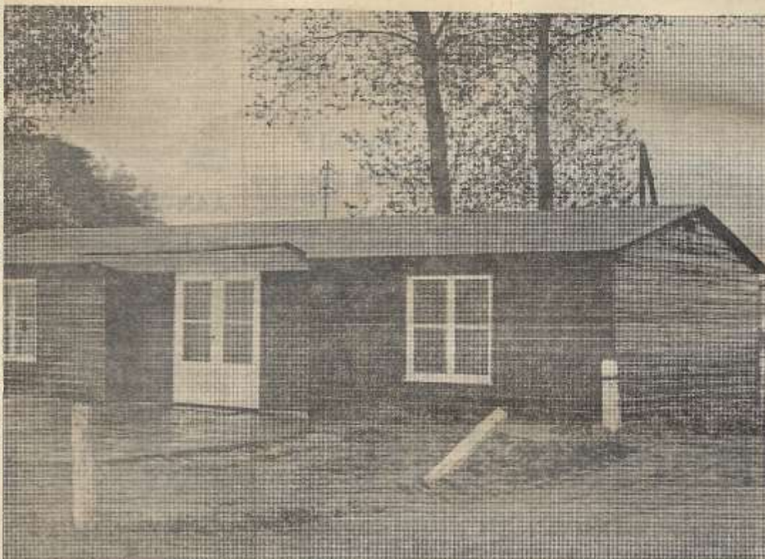
De huidige accommodatie van RKZVC.