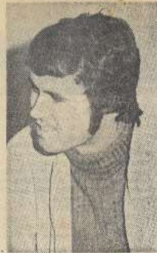
GUUS HIDDINK ...broers volgden...