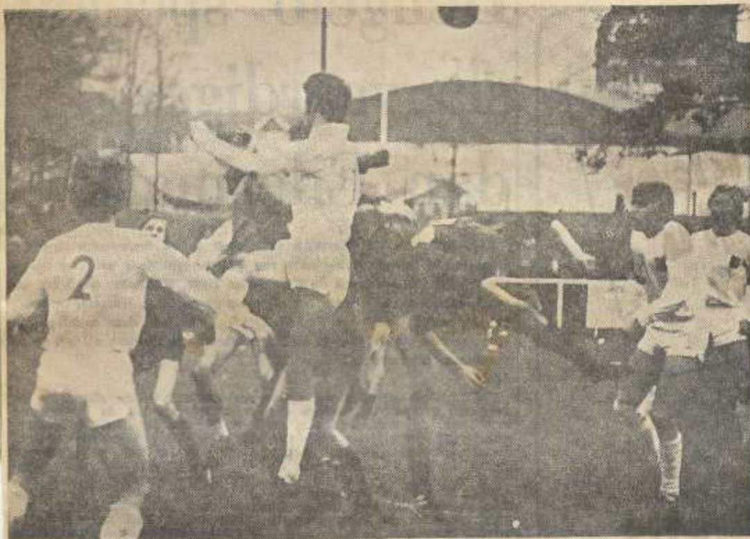
Een van de vele aanvallen van Unisson (donkere shirts) op het doel van RKZVC. Ook deze keer lukte het de Boekeloërs niet de actie te verzilveren.