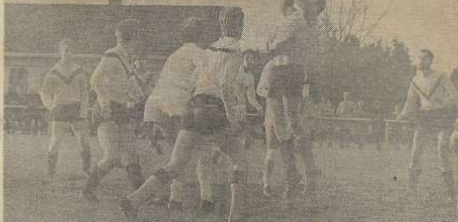
RKZVC—RUURLO 3—1 — De mannen uit Zieulent, die koploper Vios heel goed blijven volgen, maakten ook gisteren in de thuiswedstrijd tegen Ruurlo geen fout. Op deze foto zijn de RKZVC-ers weer eens in het offensief. De doelman van Ruurlo zal deze keer echter baas blijven.

RKZVC (Thuis tegen Ruurlo:) Eekelder; Holkenborg; Krabbenborg; Eekelder en Hulsink; Storkhorst; Peeters en Kemkens; Klein Zeggelink; Elschot en Domhof.