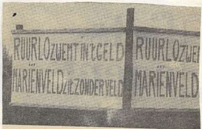
Het alles-zeggend bord op het toekomstig veld van Mariënveld