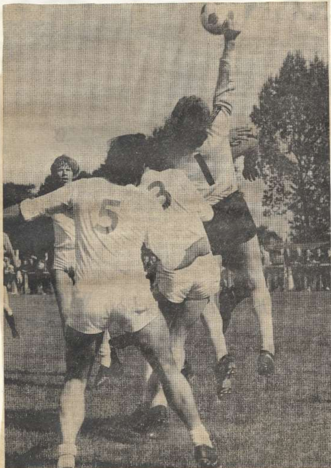
Het is de vraag of de defensie van RKZVC — hier in actie tegen Ajax Breedenbroek — zich zal kunnen handhaven tegen Longa.