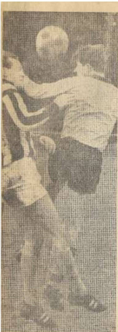
Een aanvalser van Vios, RKZVC's naaste concurrent.