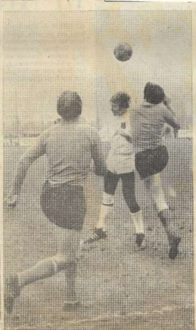
Varsseveld-RKZVC 1-0 — ZVC valt furieus aan, maar doelpunten kregen er niet.

Tot tweemaal toe wist deze op de doellijn te redden. Op het laatste moment stond de lat ZVC nog een gelijkspel in de weg. Een spetter van Dommhof kwam via de lat weer terug in het veld.