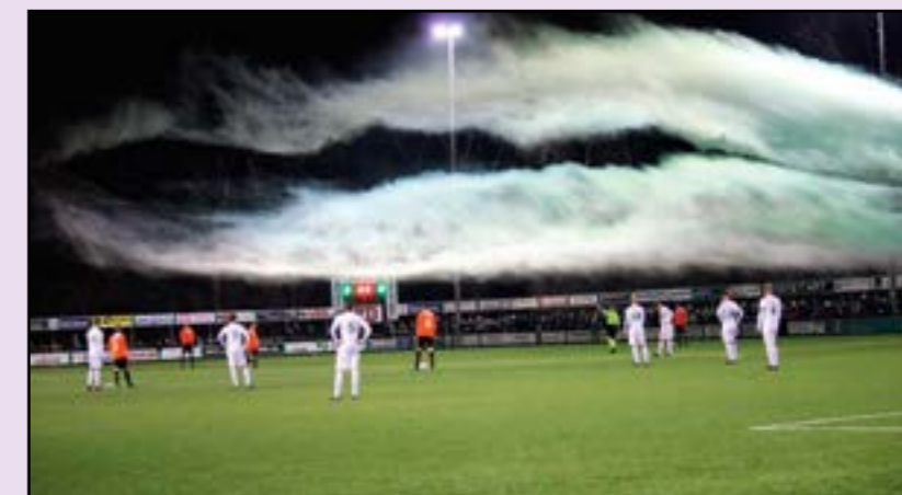
ZVC - Longa

(Data onder voorbehoud, hier kunnen nog wijzigingen in optreden.)