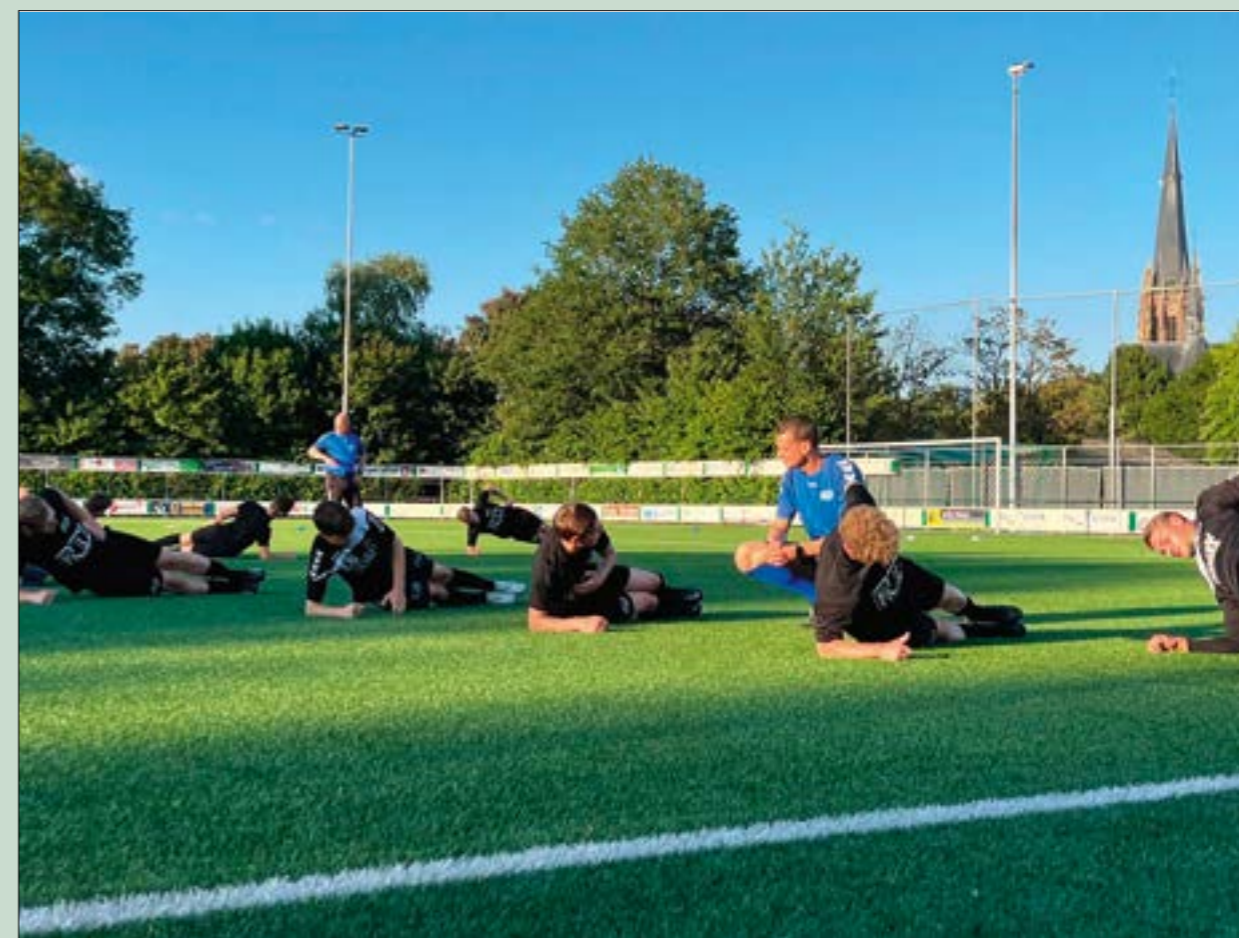
De eerste training