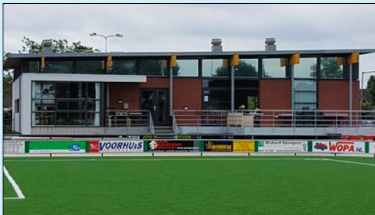
Kantine RKZVC Zieuwent