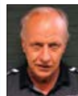
Martin Slot 06 - 51446510