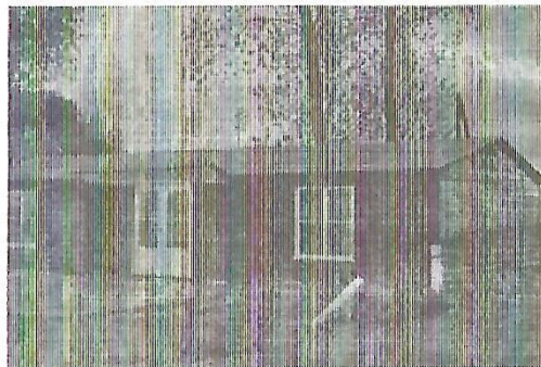
Accommodatie van voor 1973