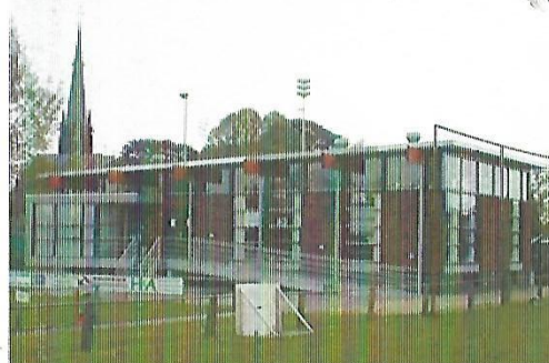
Accommodatie vanaf 2002