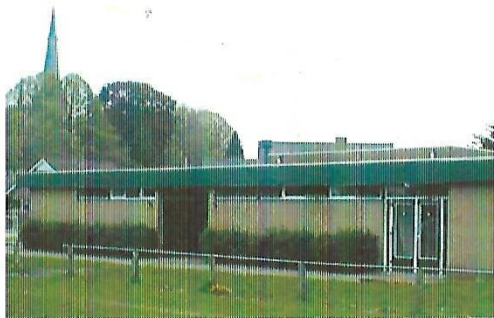
Accommodatie tot 2002