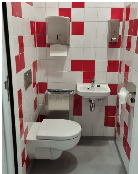
Een indruk van kleedkamers en spelerstunel