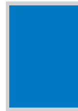
190 x 275 mm