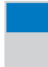
190 x 130 mm