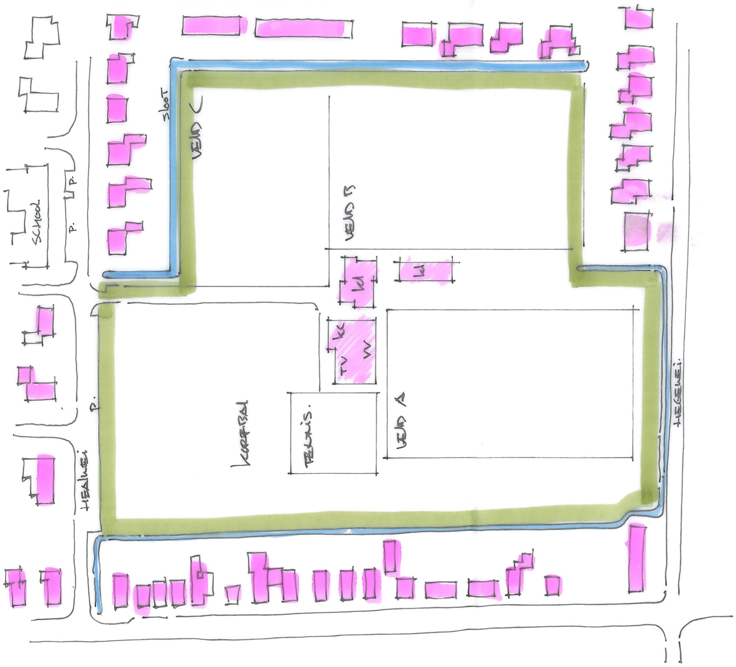
SPORTPARK DORPDEKAMP OPEINDE - BESTAAND - 1:1000