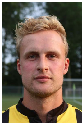
(Speler OFC 1.)