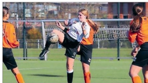
lederen moet zich welkom voelen bij Meerburg, de focus ligt ook voor een groot deel op het meiden- en vrouwenvoetbal.