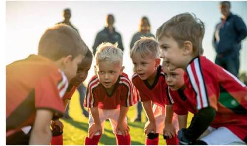
Laat de kinderen zelf het spel ontdekken

Herinner ouders eraan dat ze positief langs de lijn staan. Als begeleider ben jij het voorbeeld voor zowel de kinderen als de ouders!