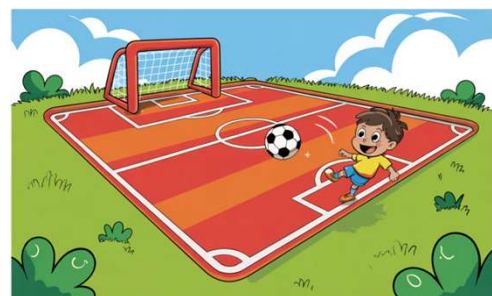
Compacte veldopstelling voor JO7-wedstrijden

Bij wedstrijden ligt de nadruk op spelplezier en leren, niet op resultaat. Alle spelers komen regelmatig aan de bal en leren spelenderwijs de basisvaardigheden.