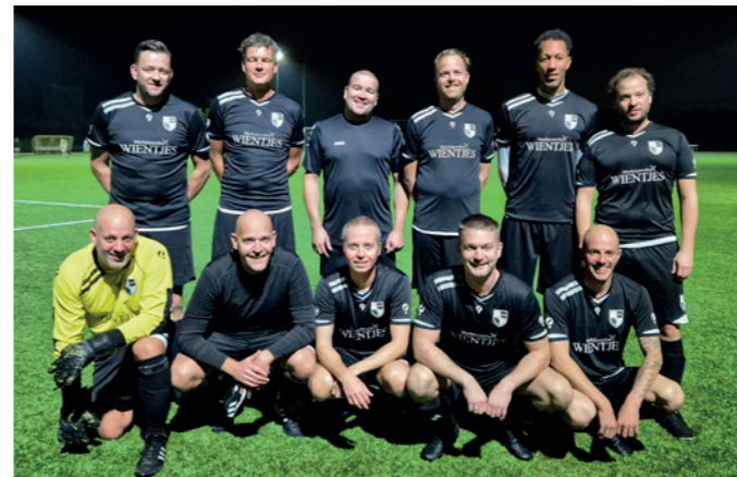
Lekkerkerk 7 tegen 7 Marktjuwelier Wientjes