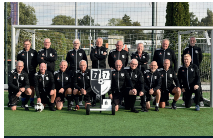
Walking Football Rabobank