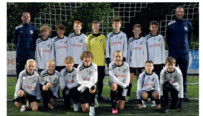
Lekkerkerk JO13-1 STAR