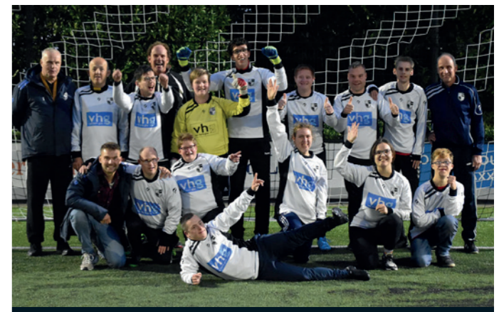
Lekkerkerk G-team Van Herk Glas