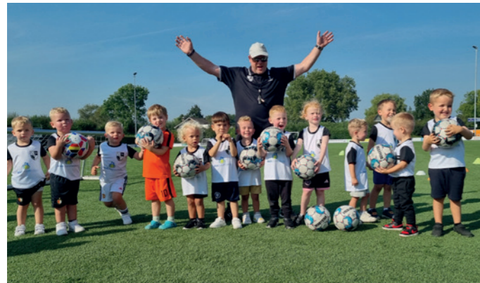
Peuters Braal Sloopwerken