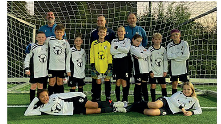
Lekkerkerk JO11-3 Van der Sijde Onderhoud en installatie / Storm Cleaning Service