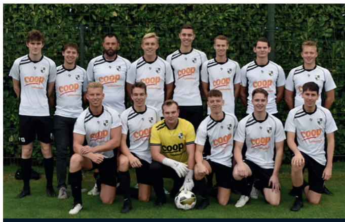
Lekkerkerk 5 COOP Lekkerkerk - Klerk interieurs