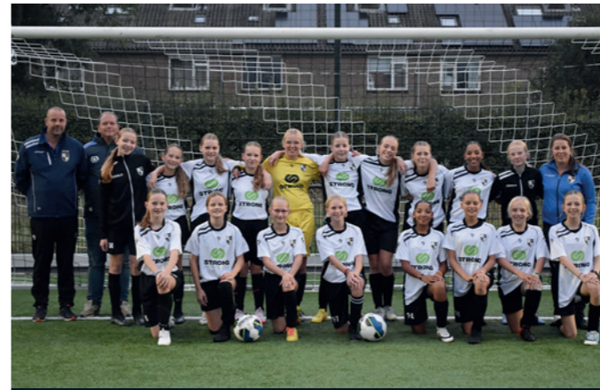
Lekkerkerk MO13-1 STRONG