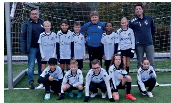
Lekkerkerk JO12-1 Steev Hoveniers