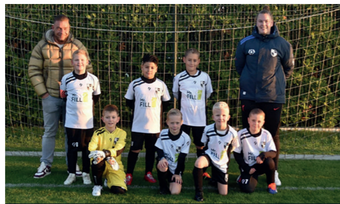
Lekkerkerk JO9-1 Mr Fill