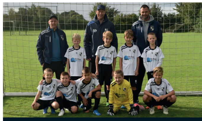
Lekkerkerk JO10-2 De Haaij Bouwwerken