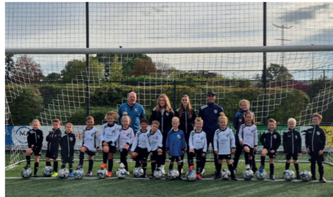
Lekkerkerk JO6-1 & JO7-1 Maxx Logistics