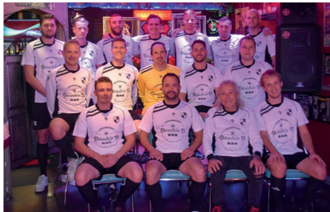
Lekkerkerk 4 Bar Double D - de Kleijne vve beheer