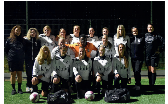
Lekkerkerk Vr 35+ Just be Jolie - Het Pandje