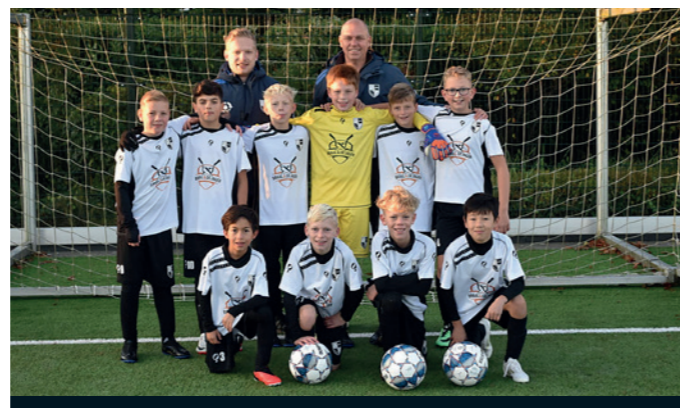
Lekkerkerk JO11-1 Braal en de Jager