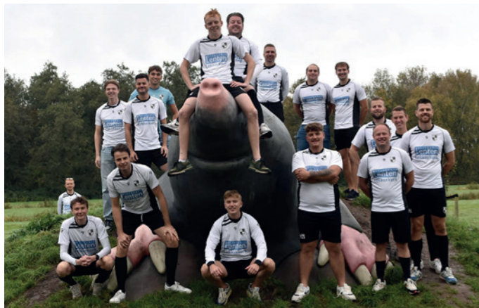
Lekkerkerk 3 Slijterij Lenten