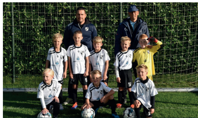
Lekkerkerk JO8-1 Braal Safety Service