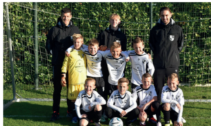
Lekkerkerk JO10-1 Bouwboer Timmerwerken