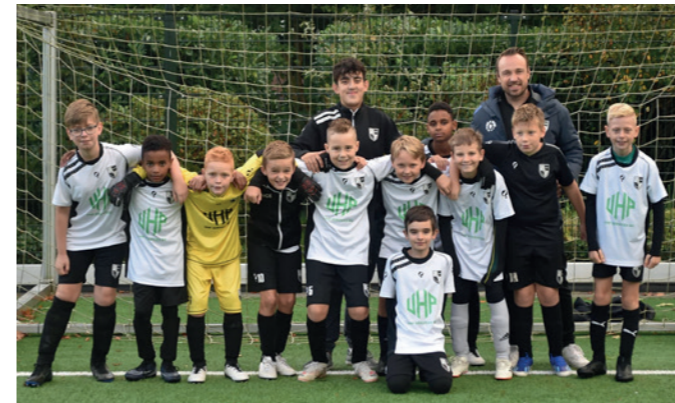
Lekkerkerk JO11-2 UHP Sevices BV