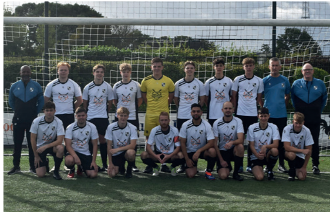
Lekkerkerk 2 Braal en de Jager