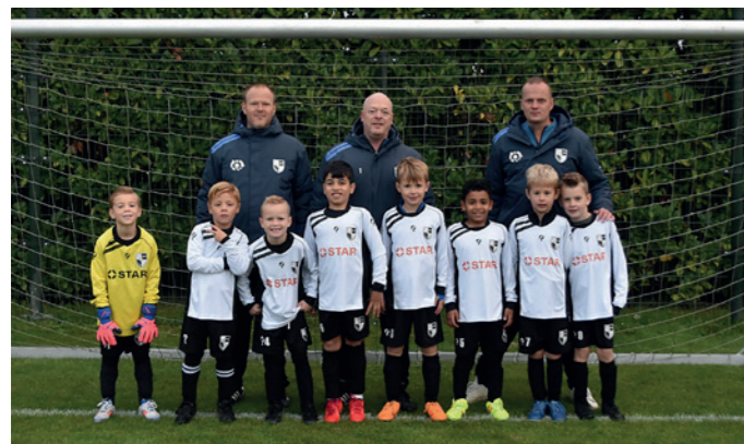
Lekkerkerk JO9-2 STAR