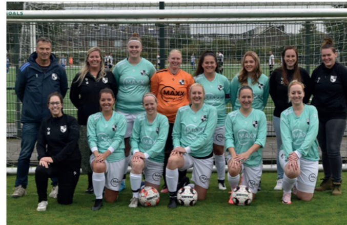
Lekkerkerk Vr 18+ Maxx Logistics