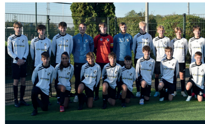
Lekkerkerk JO15-1 Müller Fresh Food Logistics