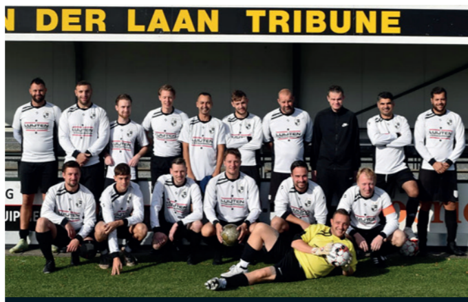
Lekkerkerk Zon 2 Luijten Verwarming