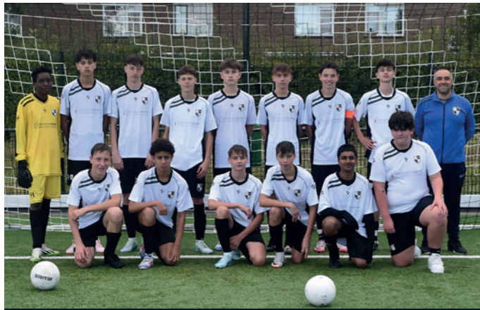
Lekkerkerk JO16-2 Schildersbedrijf Langeveld