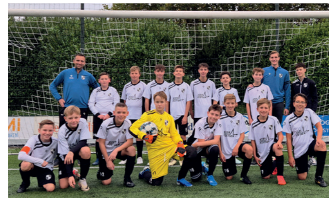
Lekkerkerk JO13-2 Ster Fietsen