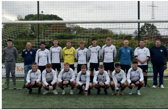
Lekkerkerk JO19-1 Wellink