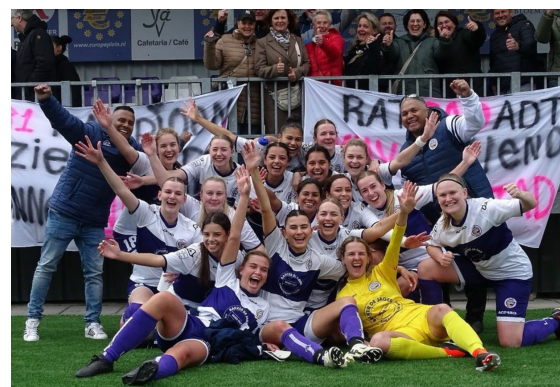
Dames 1. Trotse kampioenen in de 4 e Klasse