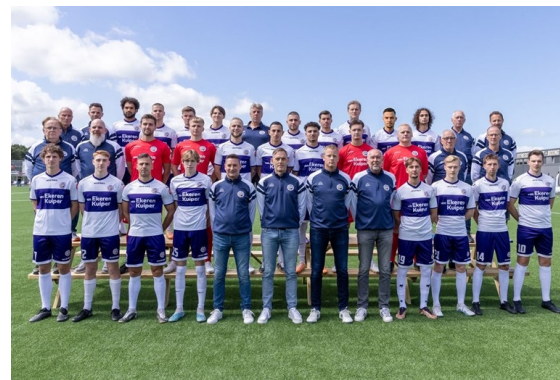
LRC1 promoveerde knap in 2023 en wist zich in 2024 te handhaven in de 4 e divisie