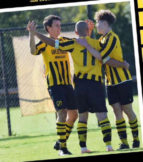
07 HEREN 1