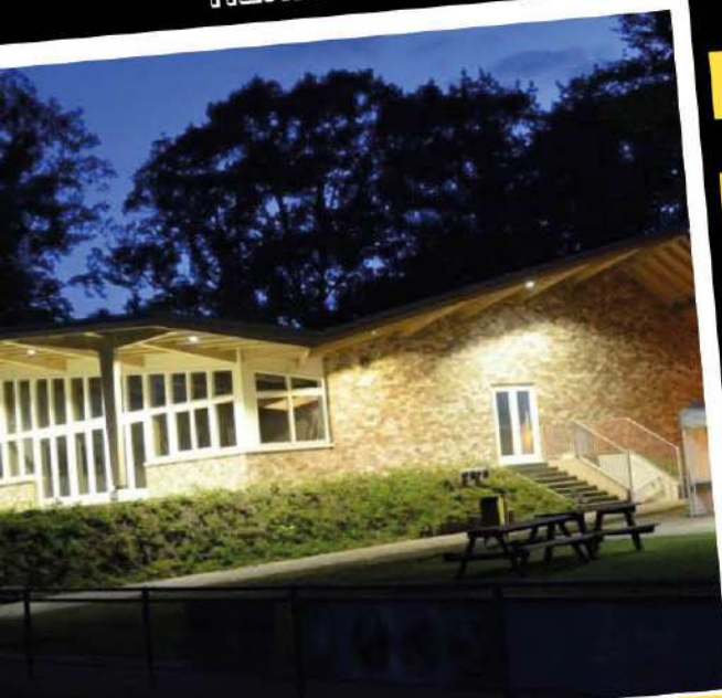
15 WAT STAAT ONS TE WACHTEN?