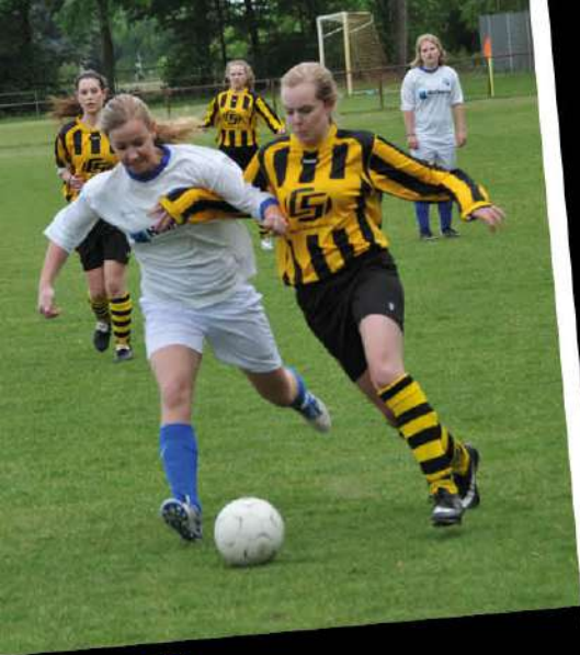
05 DAMES 1 KAMPIOEN