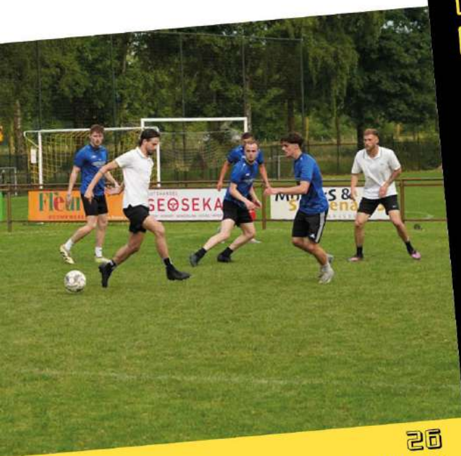
26 MINI TOERNOOI