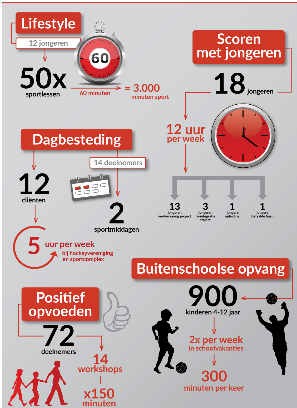
Figuur 2, Infographic opbrengst maatschappelijke pilots

De opbrengst van de maatschappelijke pilots is vanaf de start in het tweede kwartaal van 2014 in kaart gebracht door het Mulier instituut, bureau voor sociaal-wetenschappelijk sportonderzoek. Op basis van een startgesprek, twee tussentijdse ijkmomenten en eindgesprekken is de opbrengst van de pilots in de vorm van bereik, behaalde doelen en inzicht in knelpunten vastgelegd.