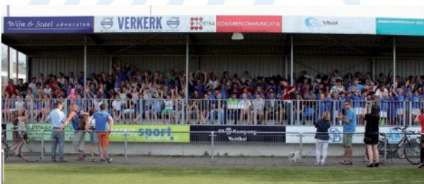
Uitreiking Kampioensdubbeltjes 2015-2016