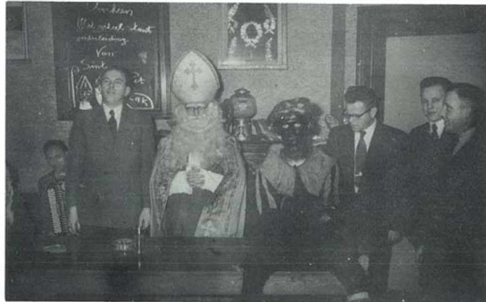
De Sint en zijn knecht op bezoek bij VVIJ

In de vijftiger jaren was het een goede gewoonte van De Sint en zijn knecht om de Sinterklaasavonden van VVIJ hoogst persoonlijk te bezoeken. De Sint wist enorm veel van VVIJ. Hij prees wat nodig was maar schuwde evenmin de critiek. Hij liet deze beslist niet onder „de schimmel” zitten. De VVIJ-ers uit die tijd zullen bij het aanschouwen van onderstaande foto met een zekere weemoed terugblikken.