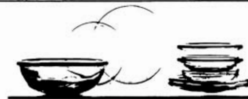
ARABIA FINS AARDEWERK

MEERENBURGERHORN 12 - IJSSELSTEIN - TELEFOON 03408-1204 LUXEMBURGWEG 12 - IJSSELSTEIN - TELEFOON 03408-3381