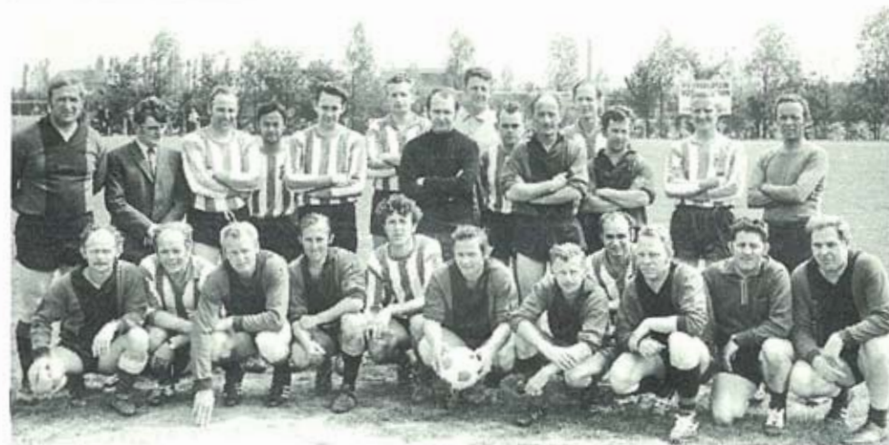
VVIJ-veteranen broederlijk op de foto met plaatsgenote IJFC