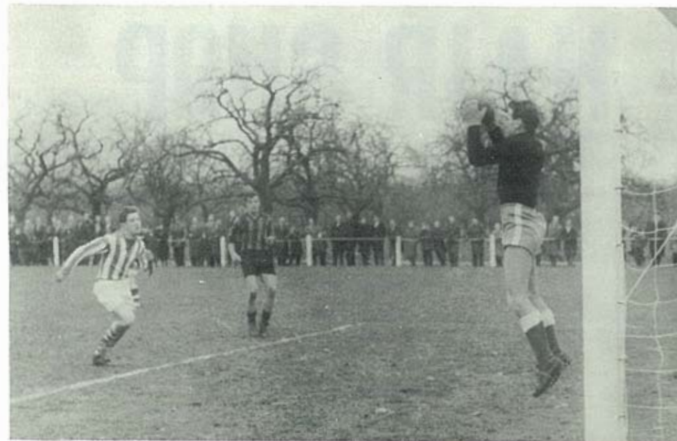
Het knusse terrein op het Hoogland