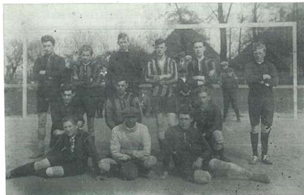
VVIJ 2 op de „Hogebeizen”

Dit weliswaar knusse maar ongeschikte terrein werd in 1930 verlaten.