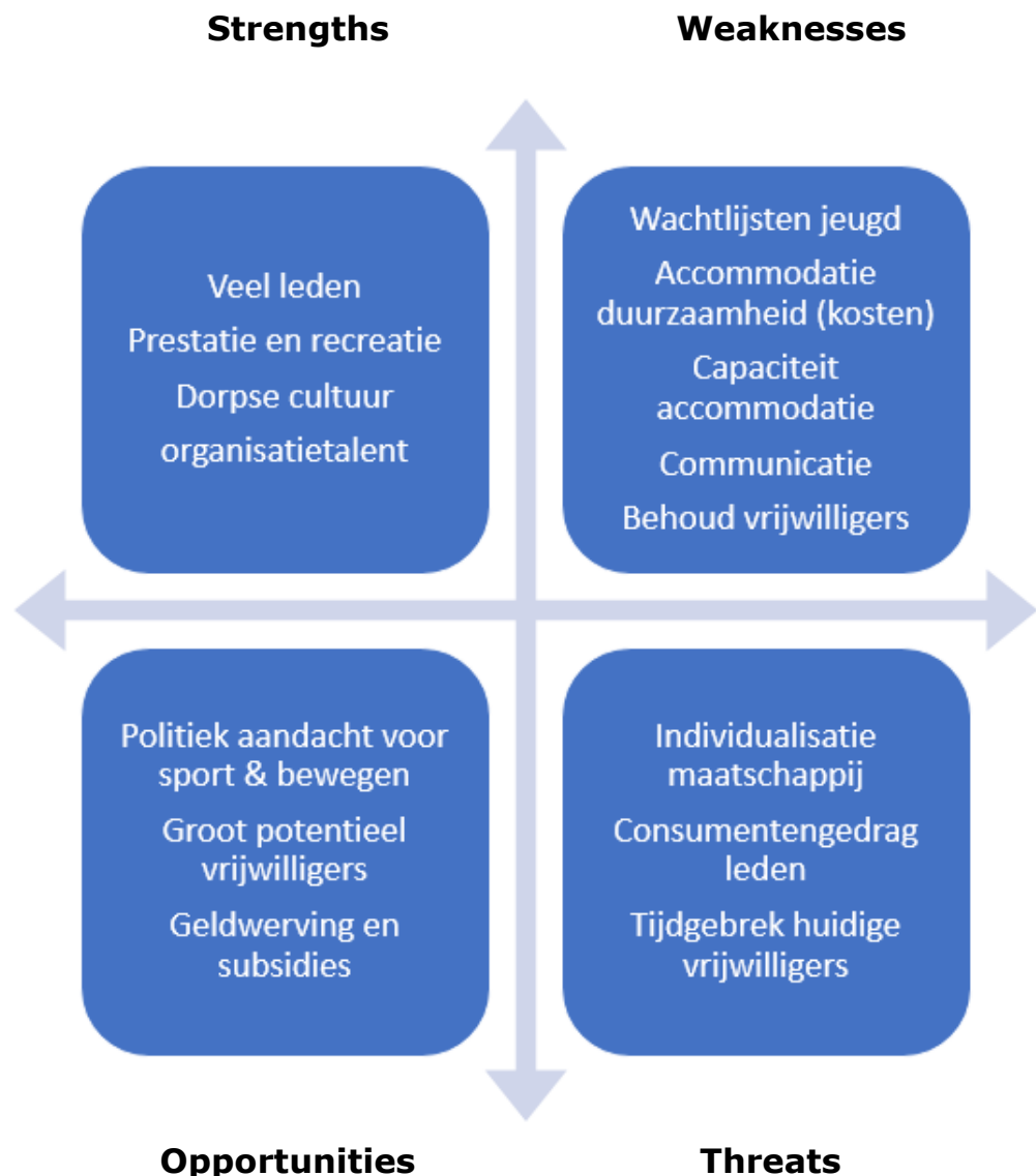
Figuur 3 SWOT-analyse

Om de interne sterktes en zwaktes optimaal af te stemmen op de kansen en bedreigingen buiten vv Hoogland is een SWOT-analyse opgemaakt. SWOT staat voor Strengths, Weaknesses, Opportunities en Threats (Sterktes, Zwaktes, Kansen en Bedreigingen). We maken hiermee visueel waar we willen proberen zo optimaal mogelijk onze kansen te benutten en met bedreigingen om te gaan. Daarnaast zien we welke sterktes we meer kunnen inzetten en waar onze zwaktes liggen die willen verbeteren.