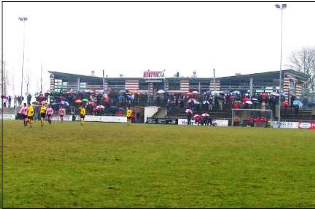
Hollandia, uw vereniging sinds 1898

Tot zover deze nieuwsbrief. (helaas iets later dan gepland, waarvoor excuses). U hoort zeker nog van ons!! Wij rekenen ook dit seizoen op u!!