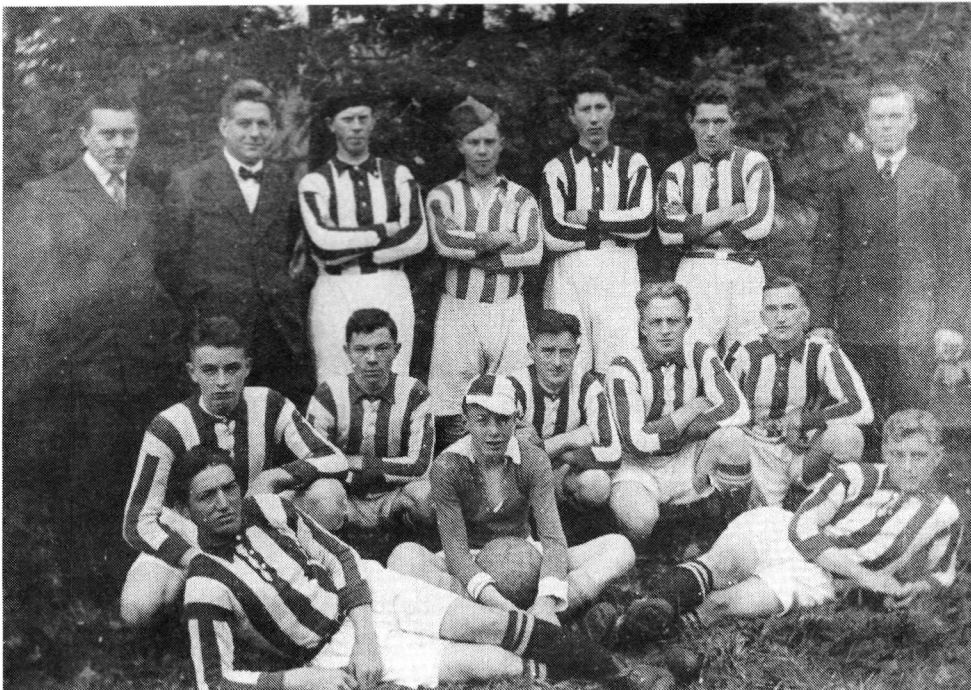
AJAX 1 1933.

In 1933 wordt er door de sinds enkele jaren in Heumen wonende kunstenaar Jac. Maris een foto van Ajax 1 gemaakt.