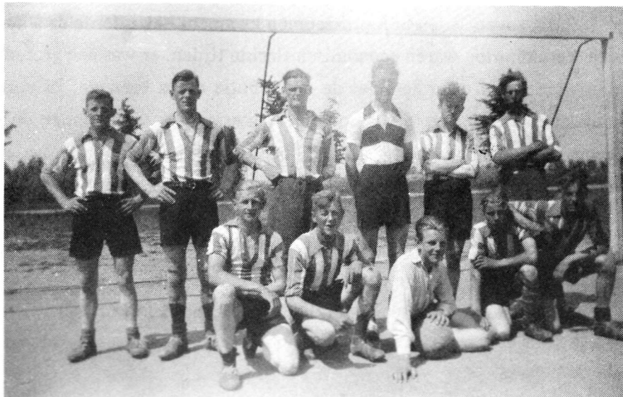
Het eerste elftal van RKVV Heumen in 1941.

De oprichting vond plaats in de oorlogsjaren, een zeer moeilijke tijd. Zo ook voor RKVV Heumen men startte met f 40,- in kas, een overschot van de voetbalclub van voor de oorlog.