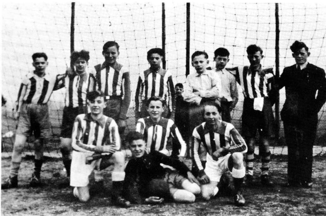
Het eerste jeugdelftal van RKVV Heumen.