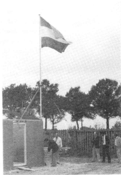
Boven: Het clubhuis in aanbouw.