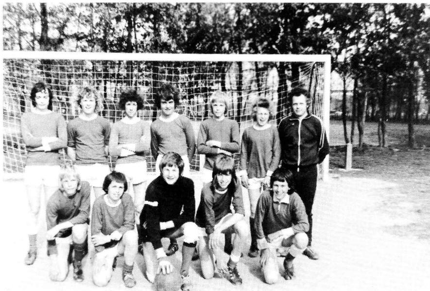
Het C-juniorenelftal van 1973: