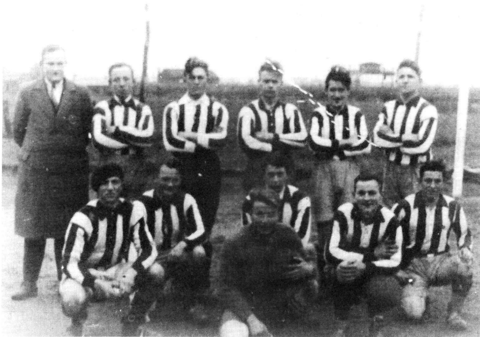
AJAX 2 1934.