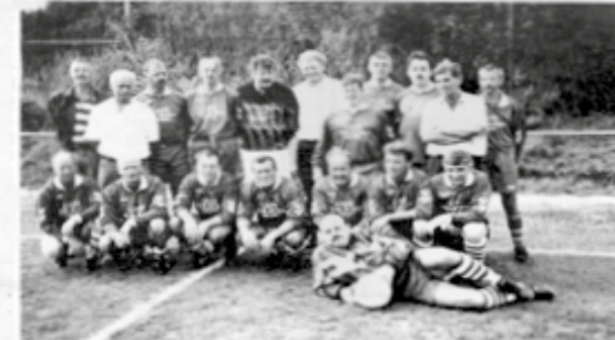
Het veteranenteam dat in Hassum (Dld) voor de tweede achtereenvolgende keer de zo fel begeerde "ALTEHERRENKIRMISWANDERPOKALTROFÉ" mee naar huis wist te nemen.