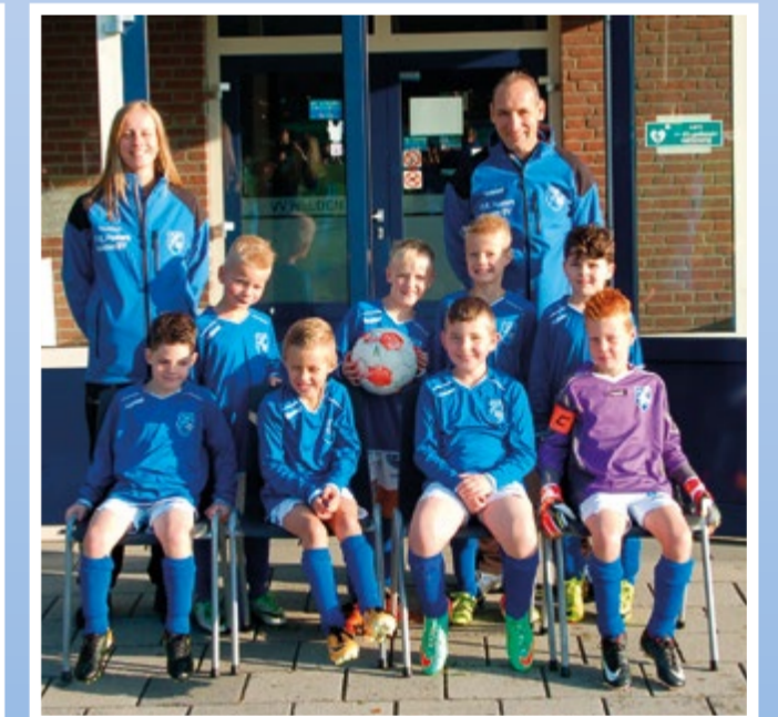
Helden Jongens onder 9 - 3