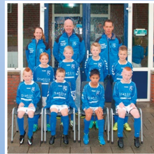
Helden Jongens onder 9 - 2G