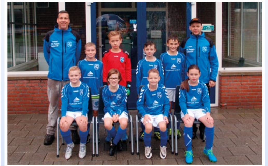
Helden Jongens onder 11 - 3G