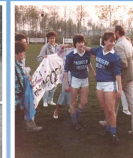
Dames vv Helden, seizoen 83-84