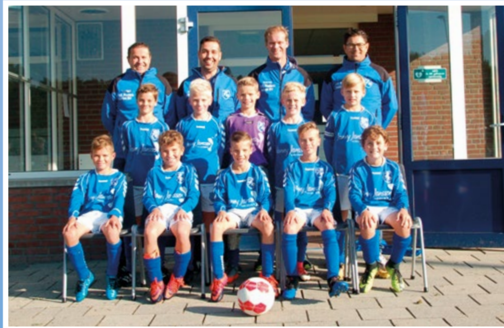
Helden Jongens onder 11 - 1