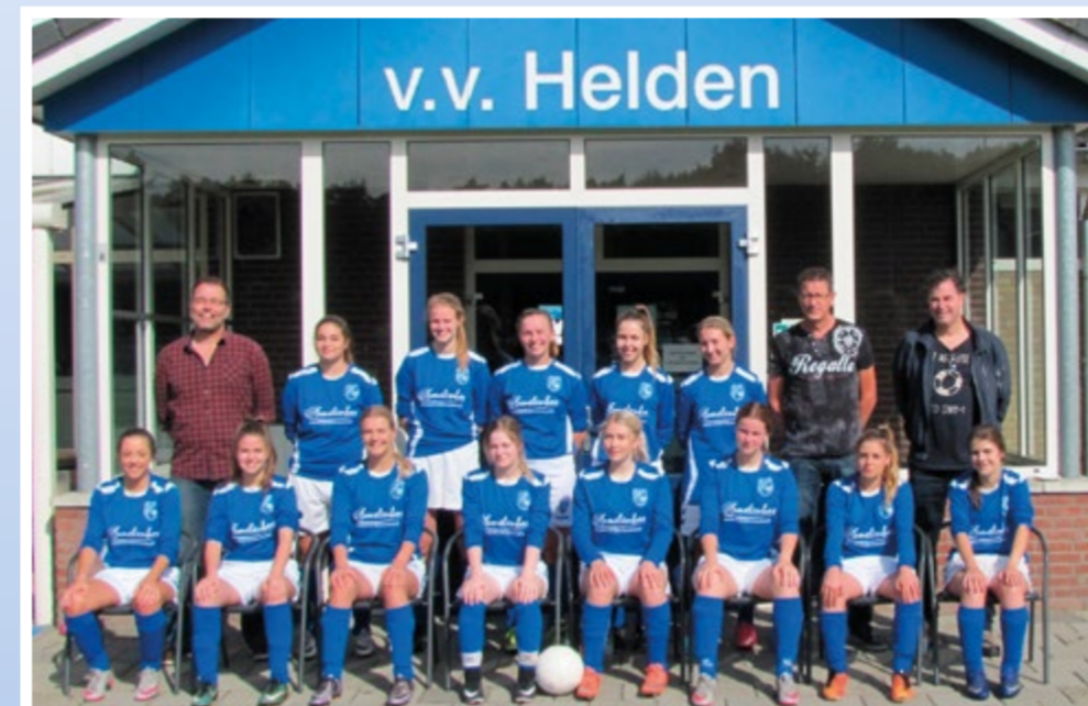
Helden Vrouwen 3