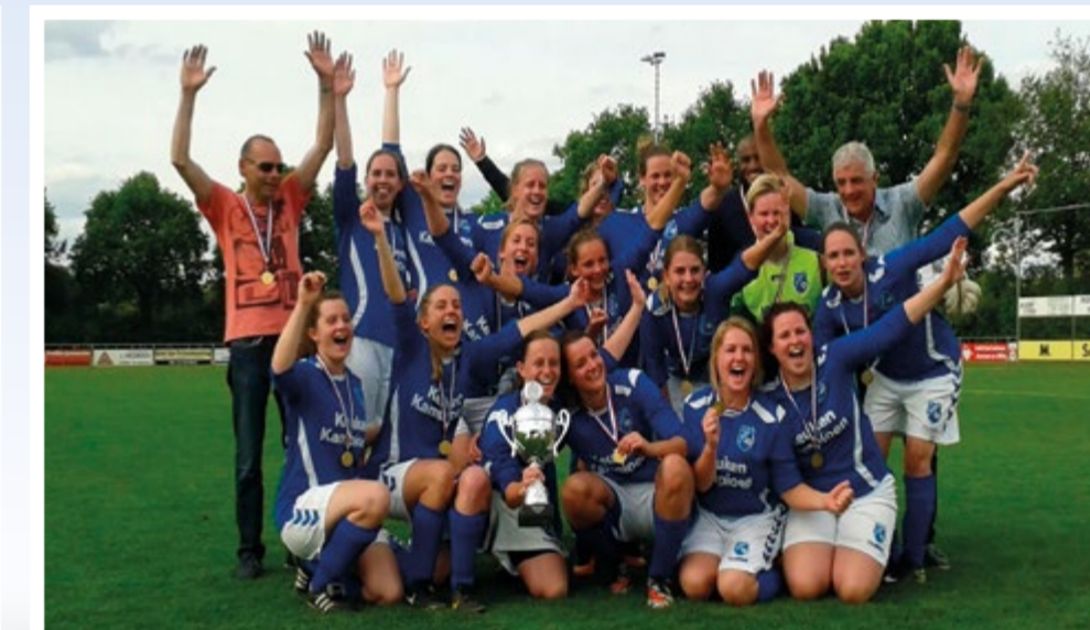
Dames vv Helden 1, winnaar KNVB Districtsbeker 2017