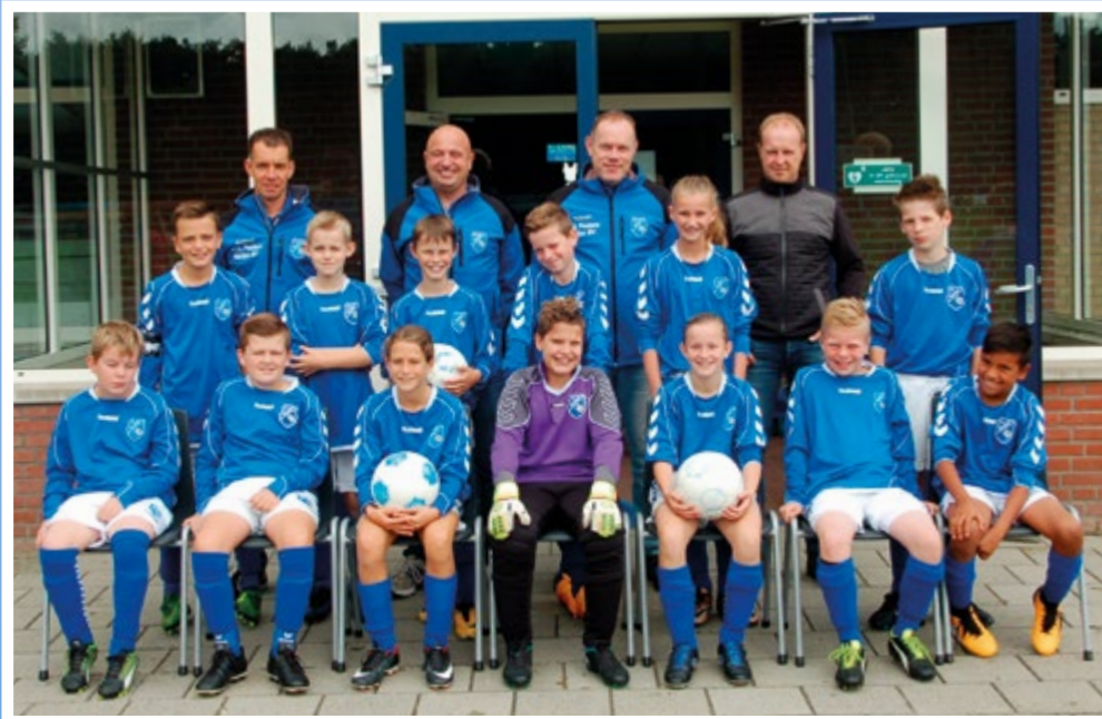
Helden Jongens onder 13 - 4G