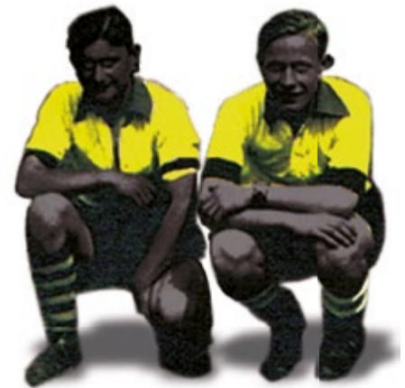
Zoengeroe en Moto