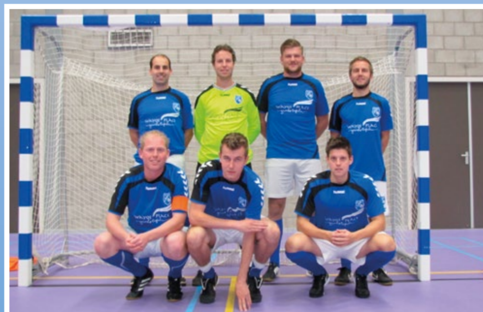
Helden 1 Zaalvoetbal