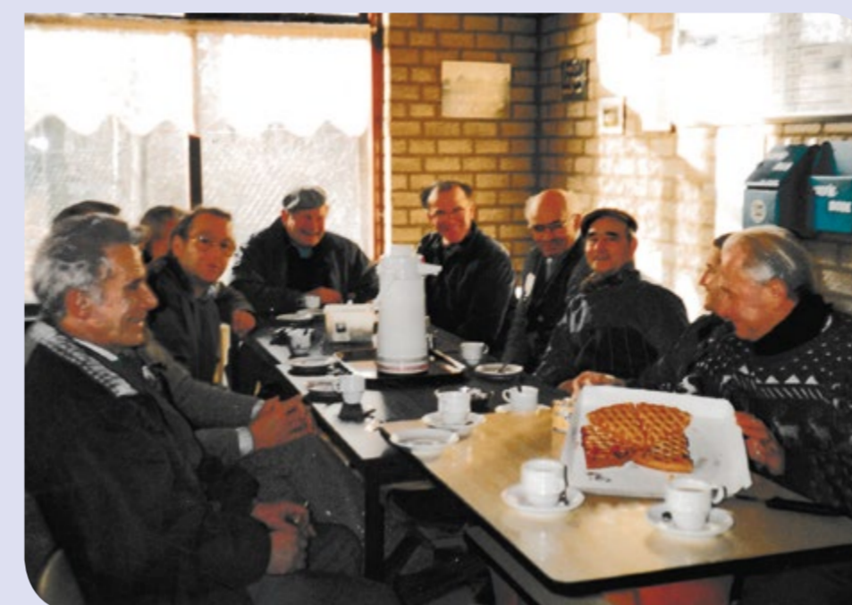
Archieffoto van een vrijwilligersploeg van weleer.

Wie bedoelen we hier eigenlijk mee? Uiteraard de vrijwilligers van vv Helden. Vrijwilligers die weg zijn als de leiders, trainers, spelers en speelsters op komen draven.