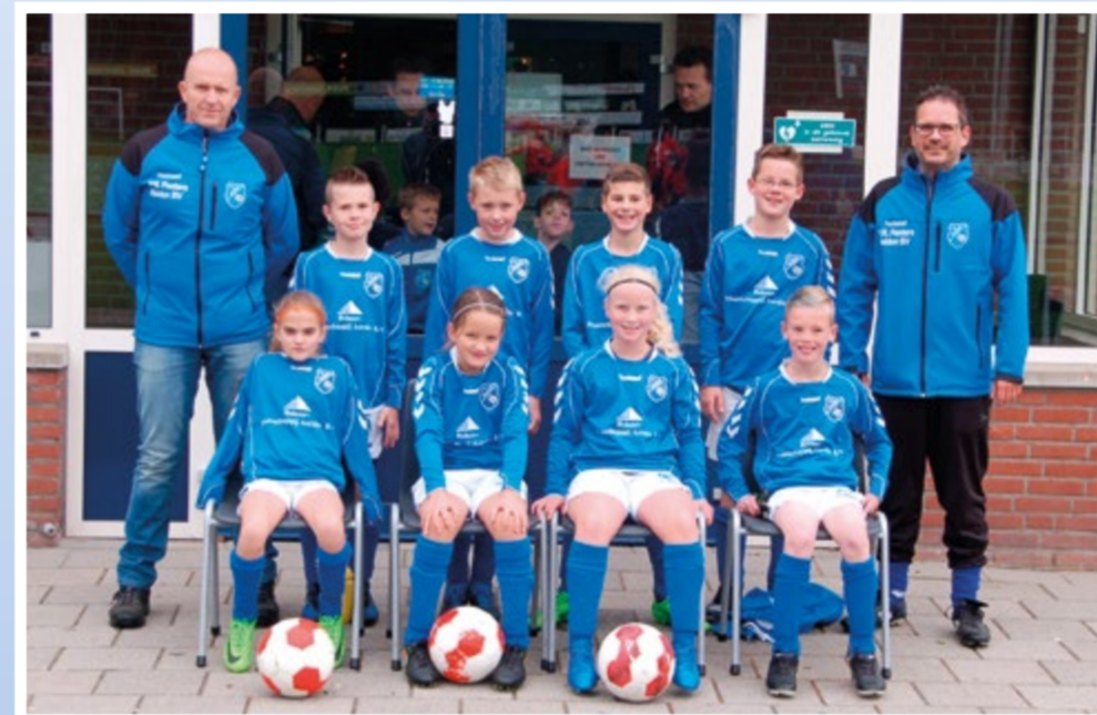
Helden Jongens onder 11 - 4G