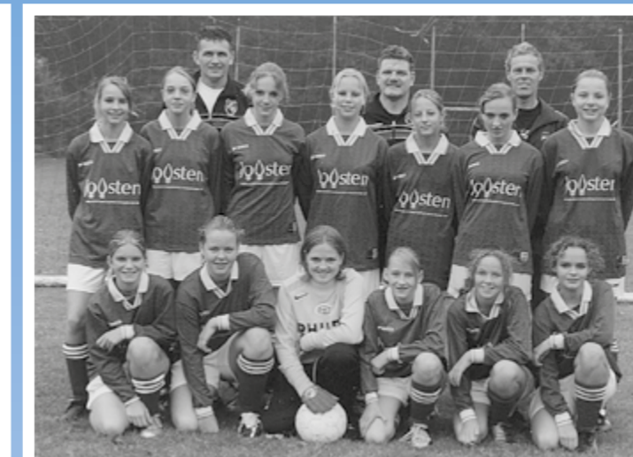
Helden MC2 seizoen 2005-2006