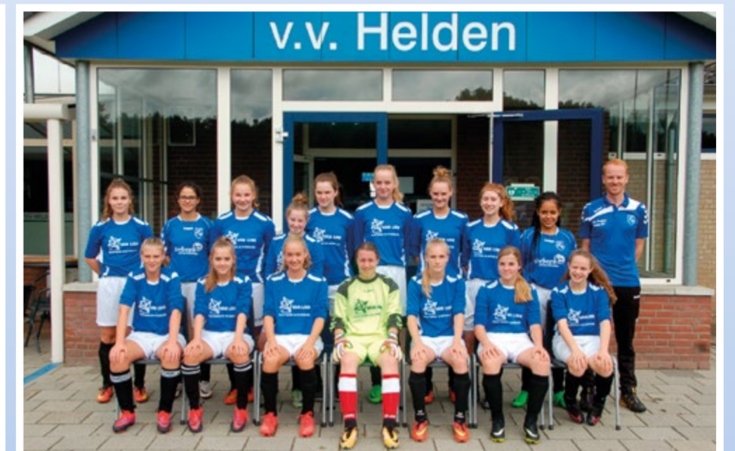
Helden Meisjes onder 17-1