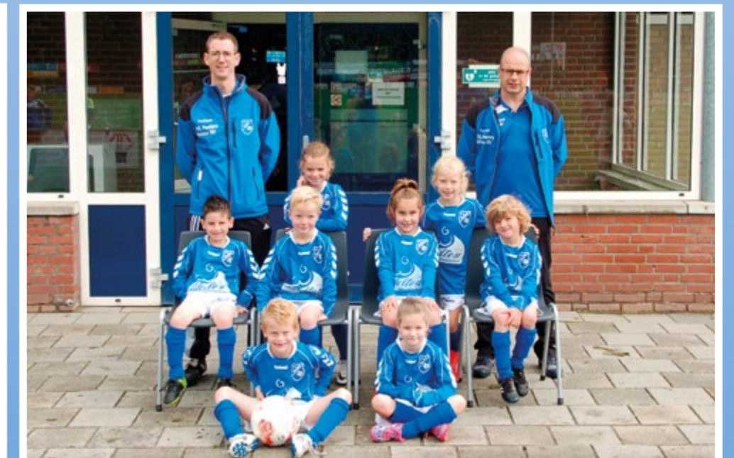
Helden Jongens onder 8 - 2G