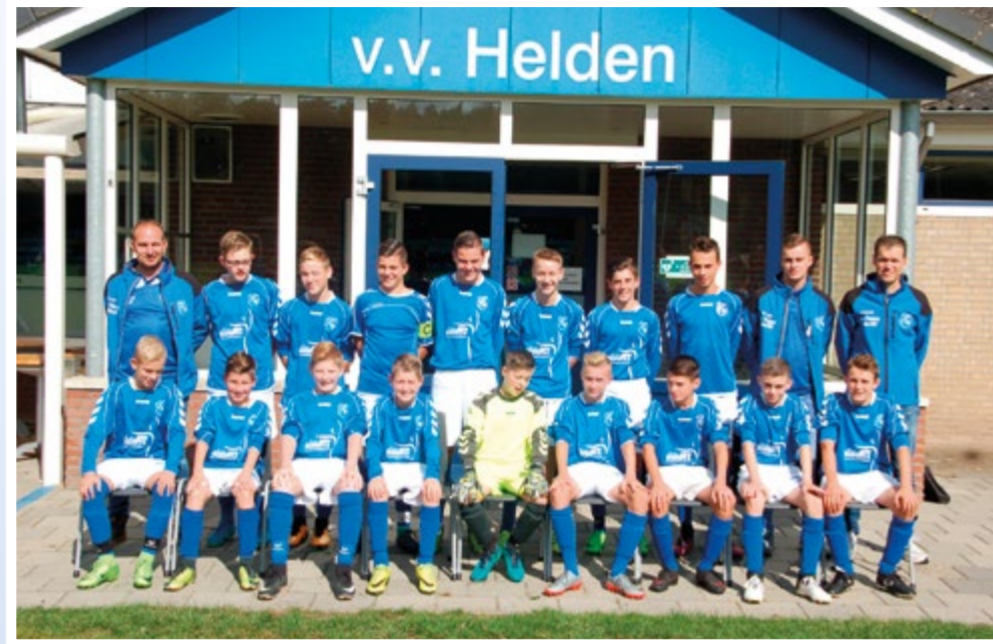
Helden Jongens onder 15 - 2