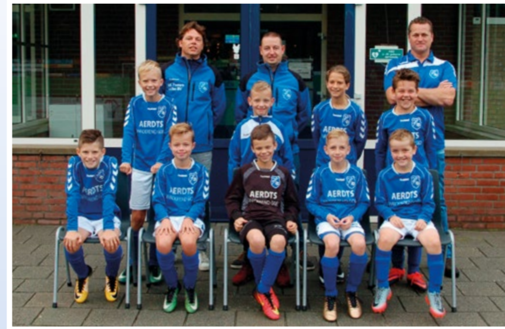
Helden Jongens onder 11 - 2