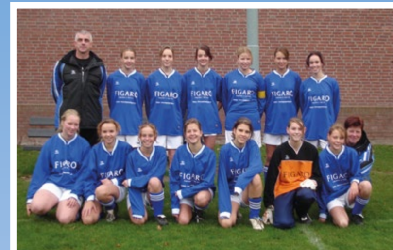
Helden MC1 seizoen 2005-2006