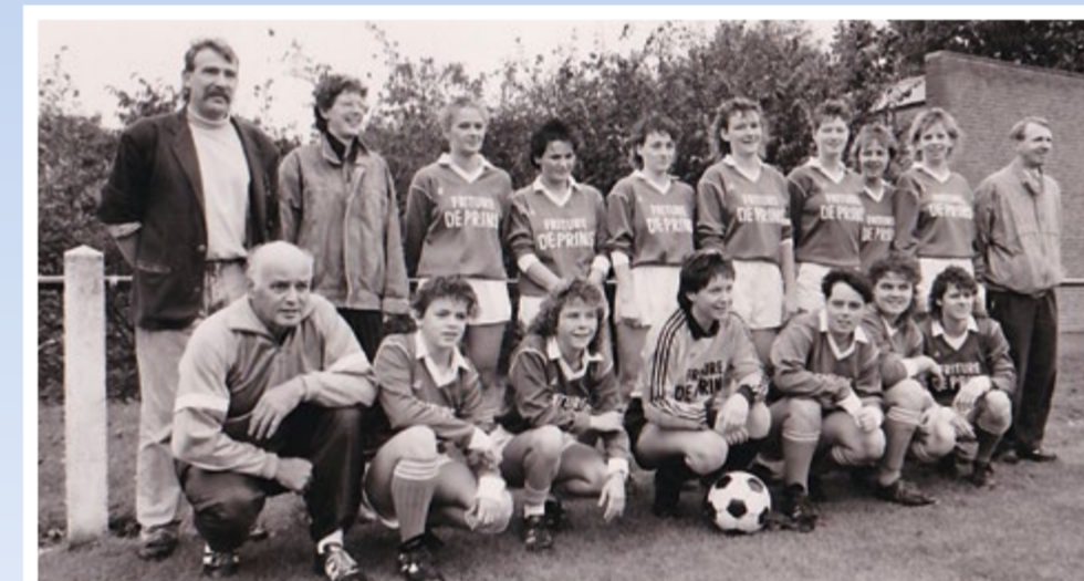
Dames 1 vv Helden, midden jaren tachtig

In 2012 werd Shurell Wilson aangesteld als trainer/coach en onder zijn bezielende leiding promoveerde het eerste team in 2015 naar de derde klasse en werd in 2017 de KNVB districtsbeke veroverd. Op dit moment is er een samenwerkingsverband met zusterverenigingen in Helden en zijn er binnen 4 verenigingen 3 vrouwenteams actief. Door deze samenwerking kunnen alle vrouwen op hun eigen niveau op zondagochtend in competitieverband spelen. Vrouwenvoetbal is dus een stabiele factor bij vv Helden.