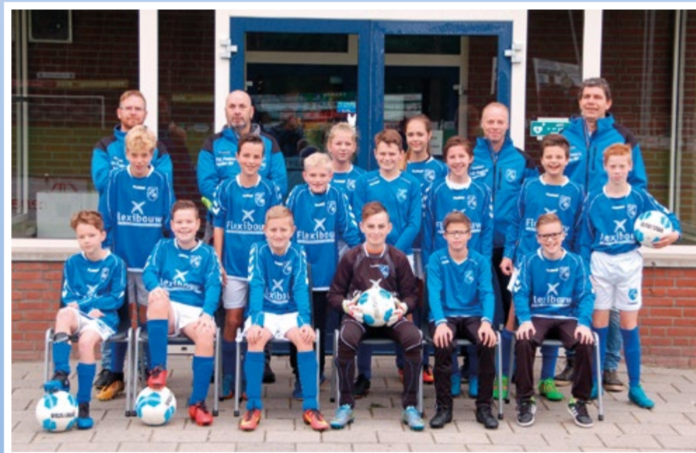
Helden Jongens onder 13 - 3G