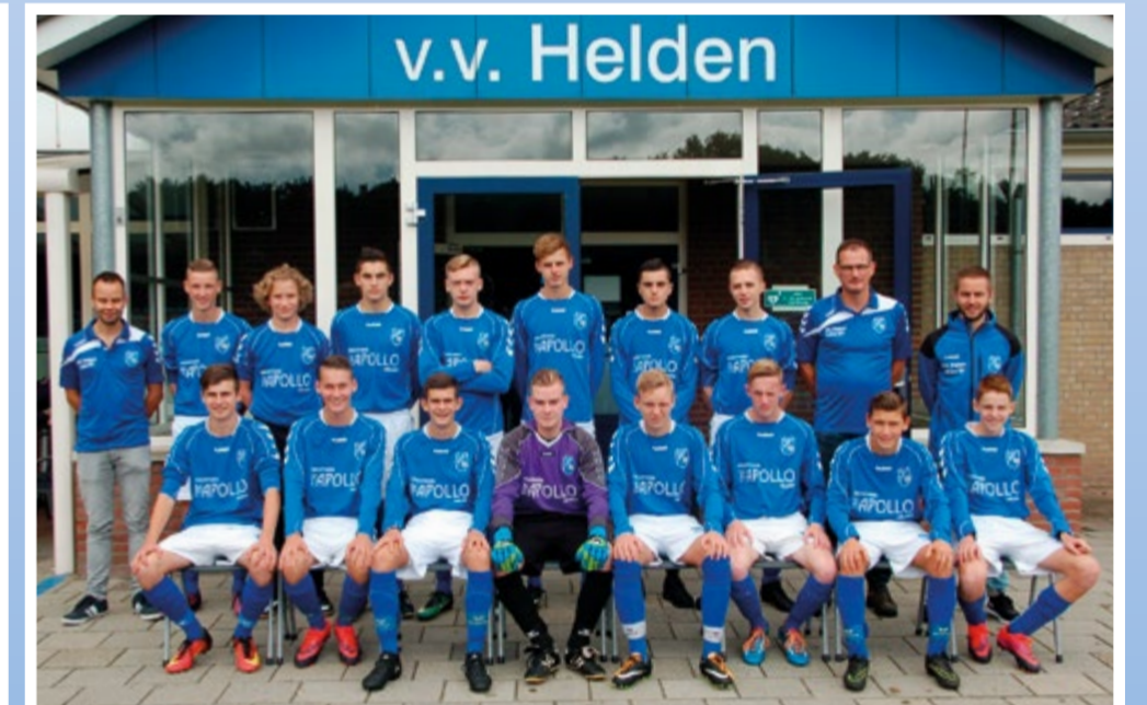
Helden Jongens onder 17-1