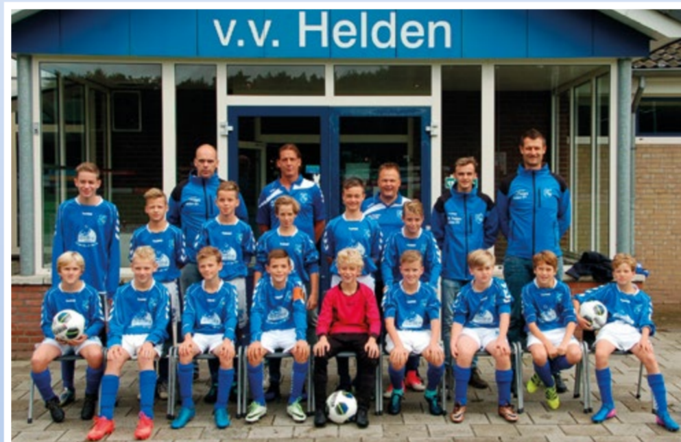
Helden Jongens onder 13 - 1