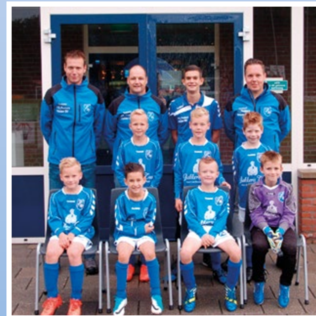
Helden Jongens onder 9 - 1