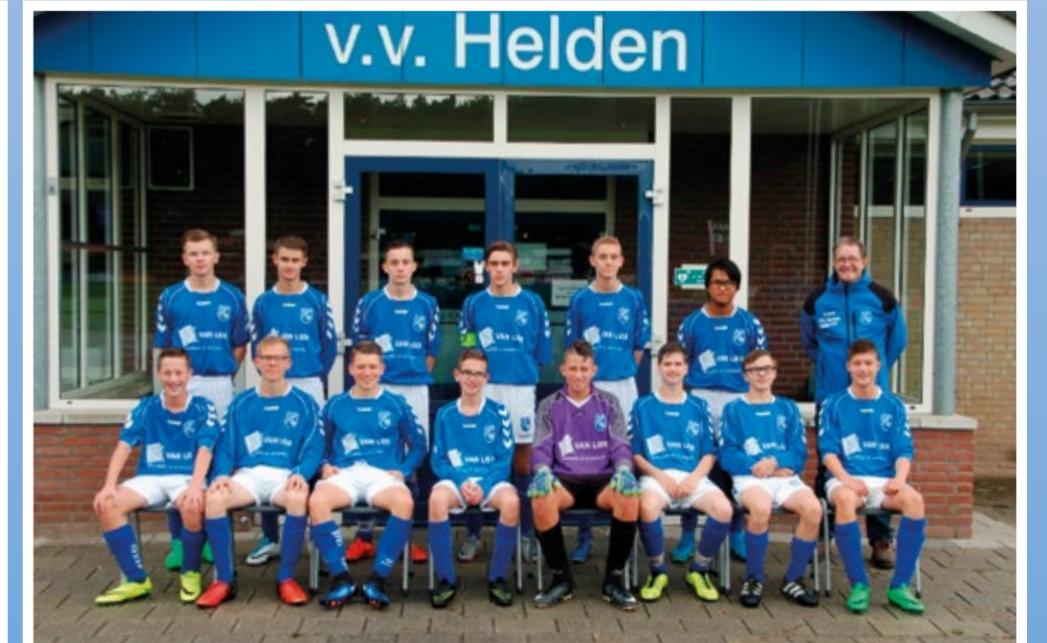
Helden Jongens onder 17-3