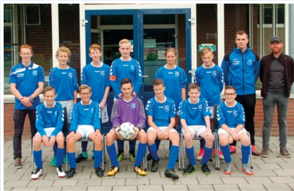
Helden Jongens onder 15 - 3G