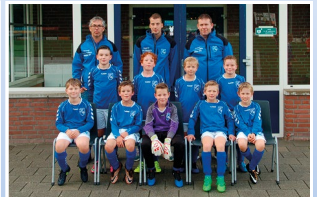
Helden Jongens onder 10 - 1