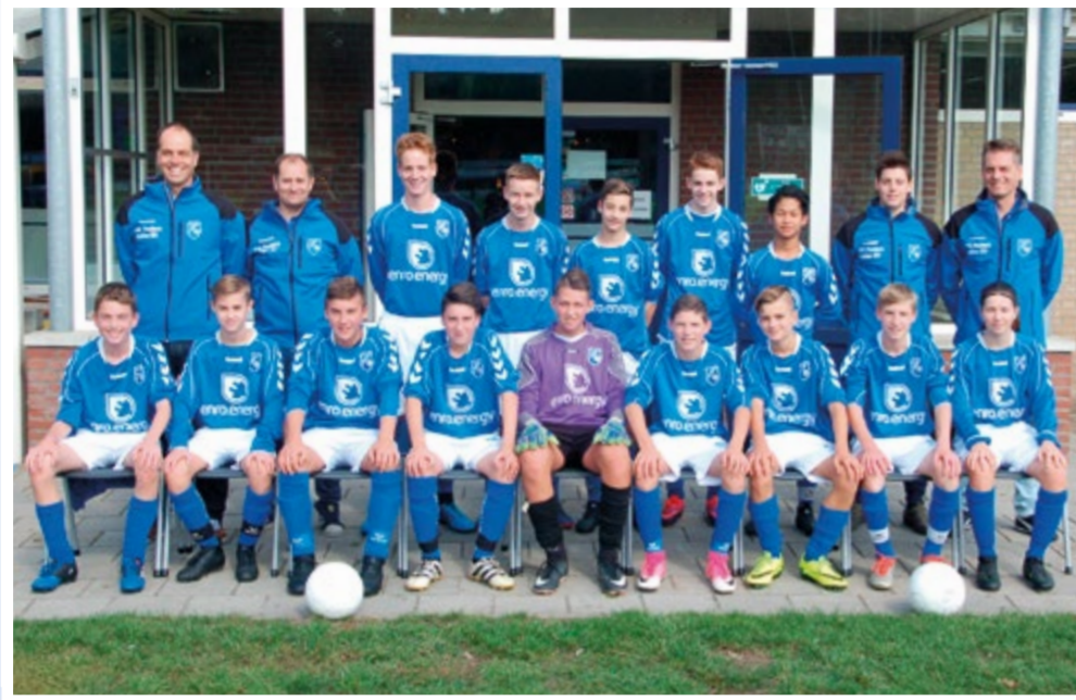
Helden Jongens onder 15 - 2