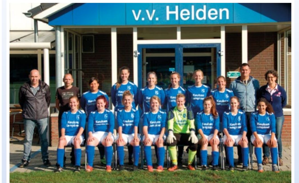
Helden Vrouwen 1