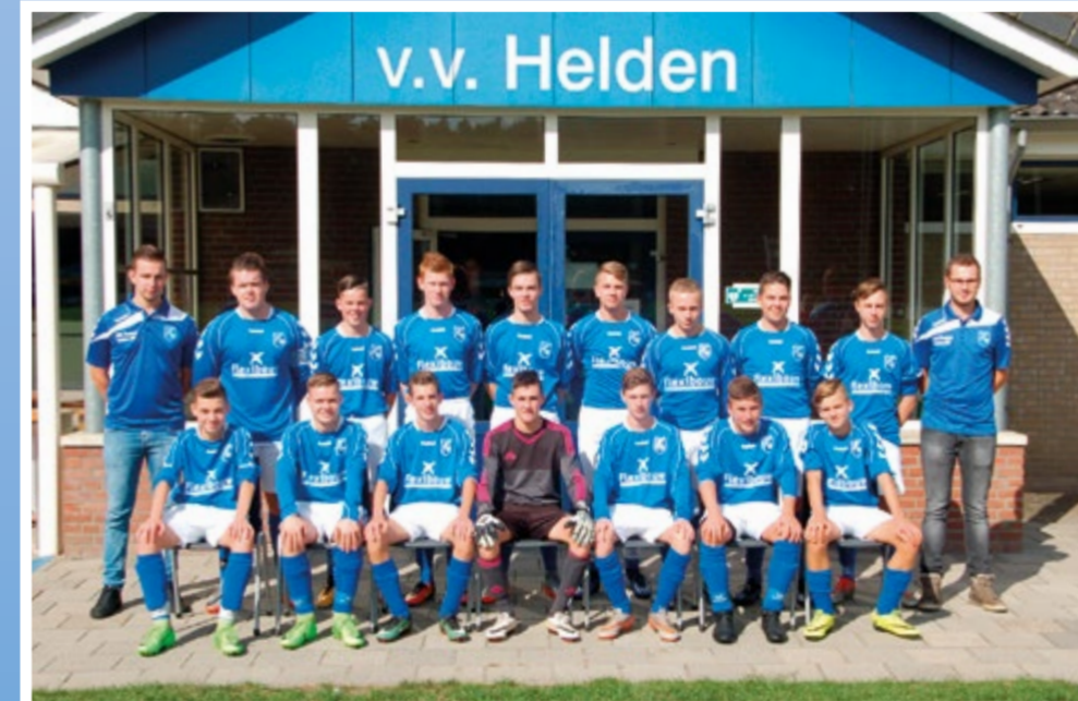
Helden Jongens onder 17-2