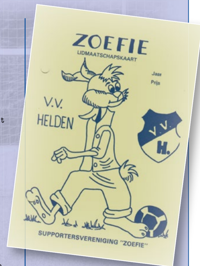
Lidmaatschapskaart van Supportersvereniging "Zoefie".

Dan wurd geploeterd en gesjouwd den aanval wurd dan opgebouwd want zoe kan Zoefie zich dan wir amuzere ze sjuve op 't middeveld en waem is dan de groëte held dae os mej op 'n geulke kan traktere