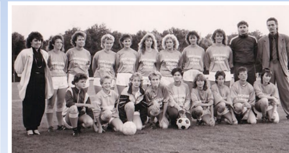
Dames 2 vv Helden, midden jaren tachtig