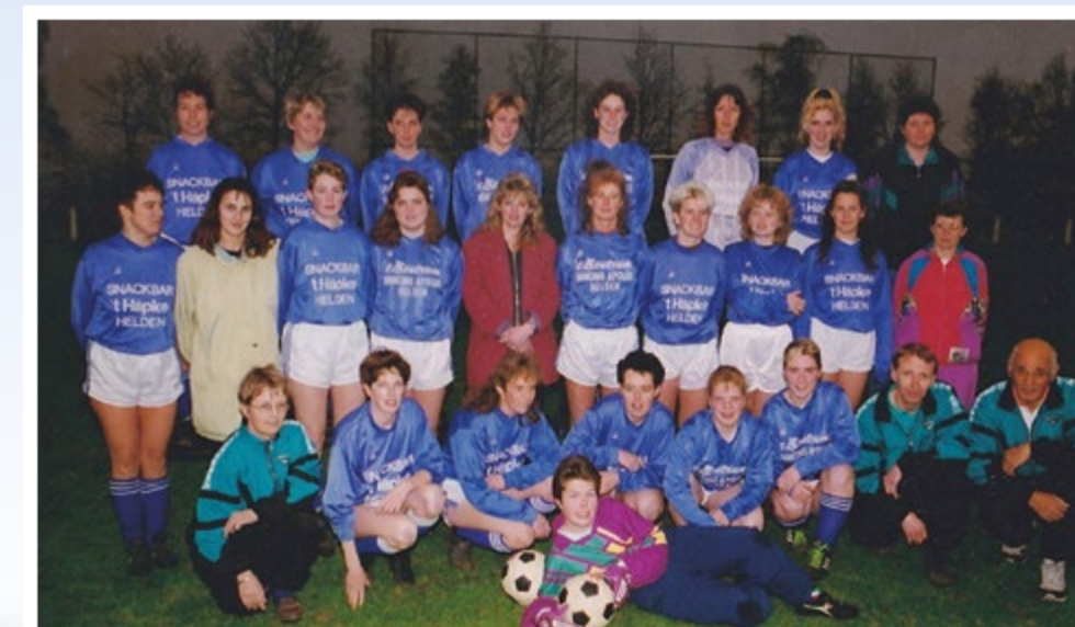
Dames 1 vv Helden, midden jaren tachtig