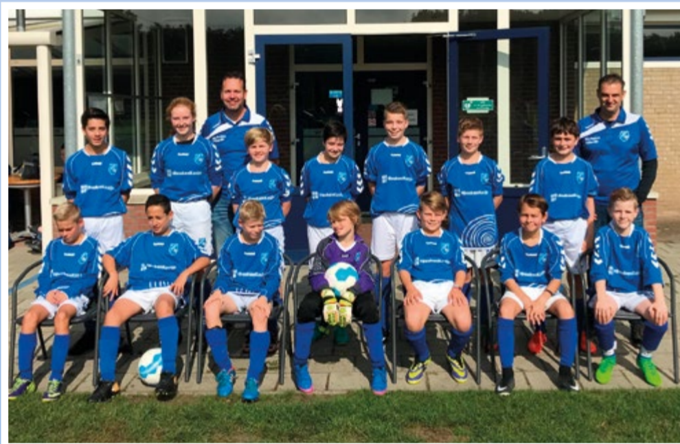
Helden Jongens onder 13 - 2G