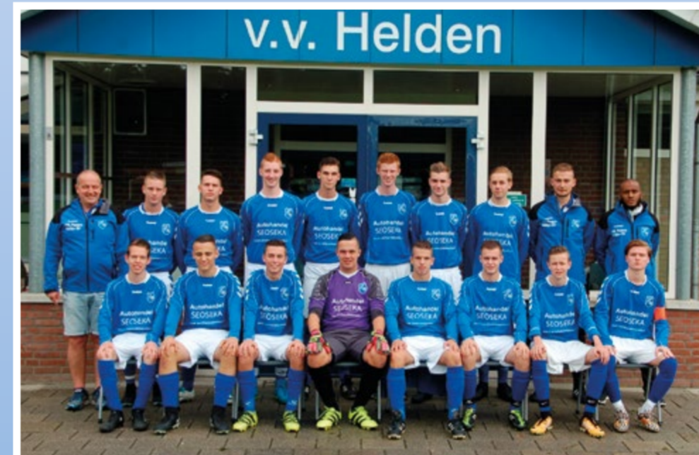
Helden Jongens onder 19-1