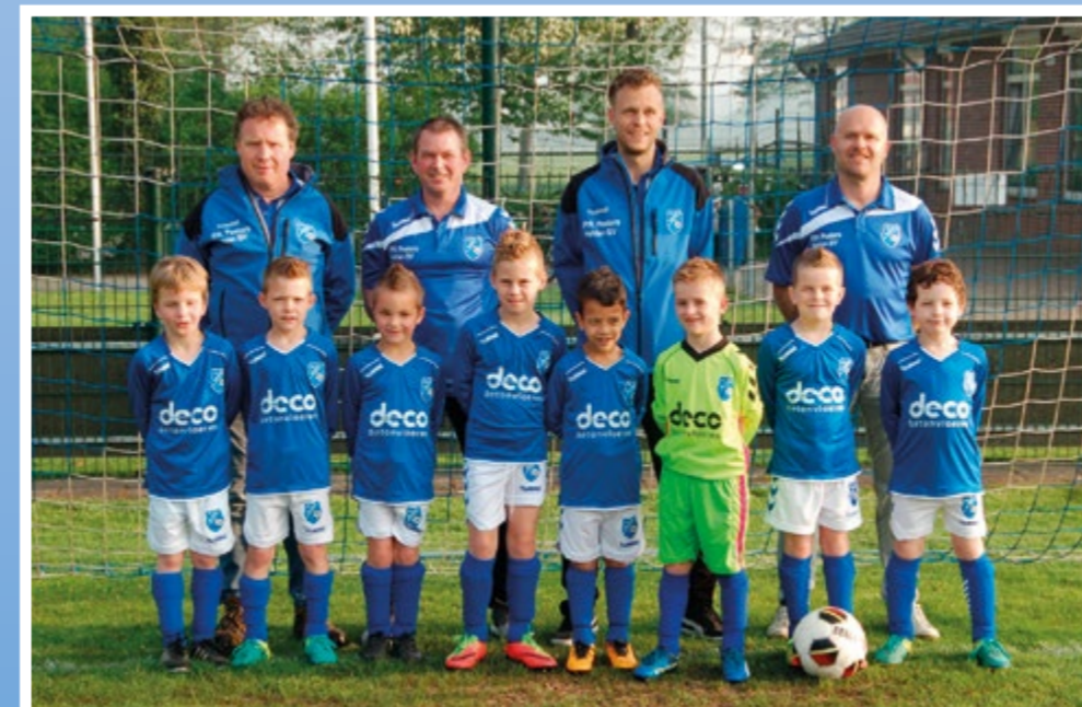
Helden Jongens onder 8 - 1