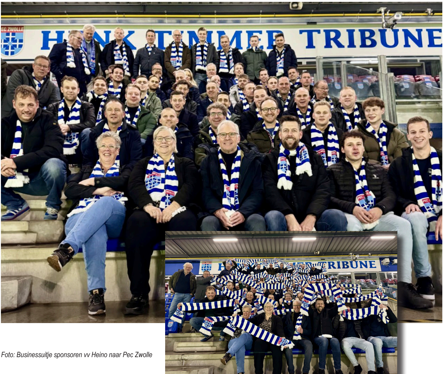
Foto: Businessuitje sponsoren vv Heino naar Pec Zwolle