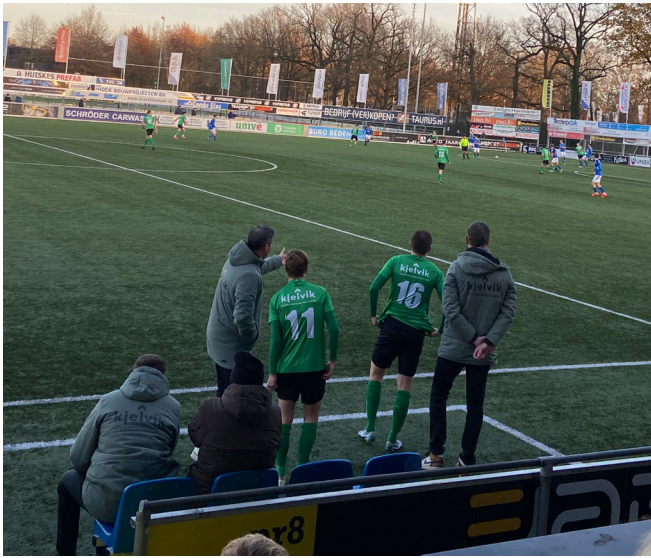
Foto: debuutfoto invalbuurt Heino1