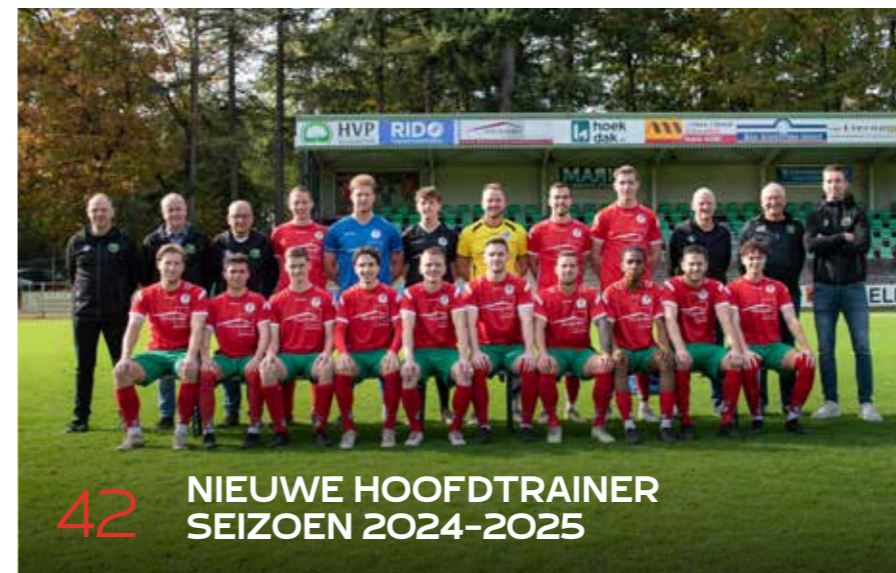
42 NIEUWE HOOFDTRAINER SEIZOEN 2024-2025