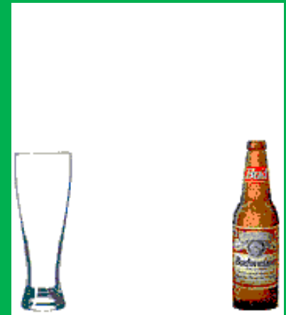
Hier begon Joop niet aan: een pilsje.