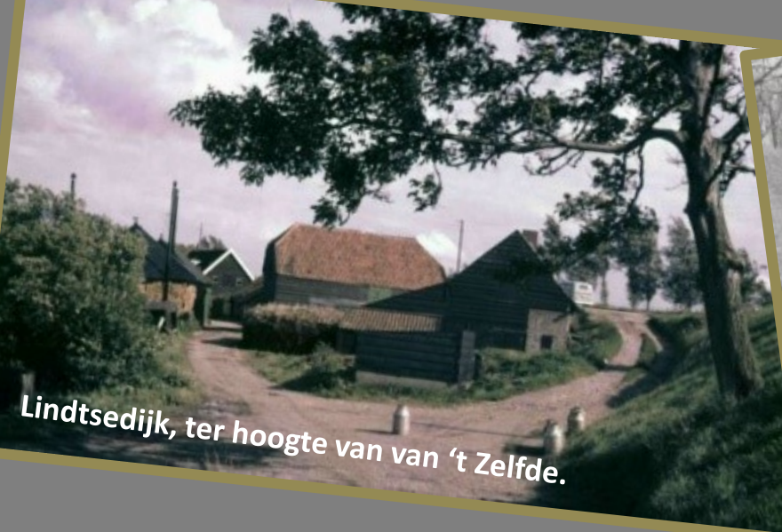
Lindtsedijk, ter hoogte van van 't Zelfde.