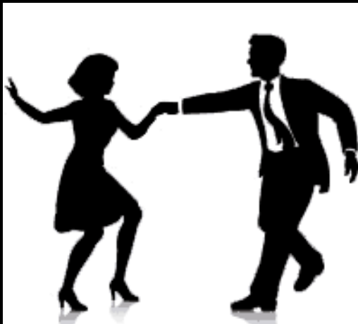
Of er nog gedanst werd, is niet bekend