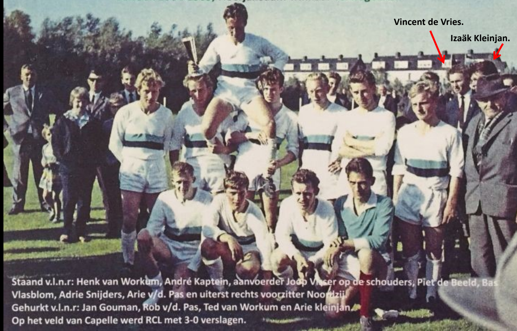
Seizoen 1964-1965, Heerjansdam winnaar Tolwegbeker.

Goed voetbal in finale Tolwegbeker HEERJANSDAM duidelijk meester over RCL: 3-0