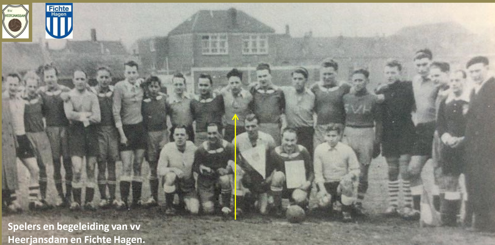
Spelers en begeleiding van vv Heerjansdam en Fichte Hagen.