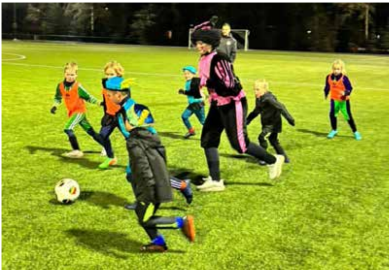
Training olv "Pieten"