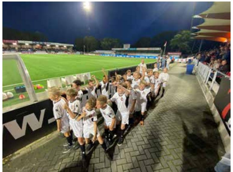
Boys jeugd bij wedstrijd Telstar-Ajax

Zonder jeugdvoorzitter wordt het voor de jeugdcommissie steeds lastiger om de jeugdafdeling draaiende te houden. Er komt te veel werk af op de huidige jeugdcommissieleden. Zij worden hierbij wel ondersteund vanuit het hoofdbestuur en door drie leiders die fungeren als contactpersoon voor bepaalde leeftijdscategorieën.