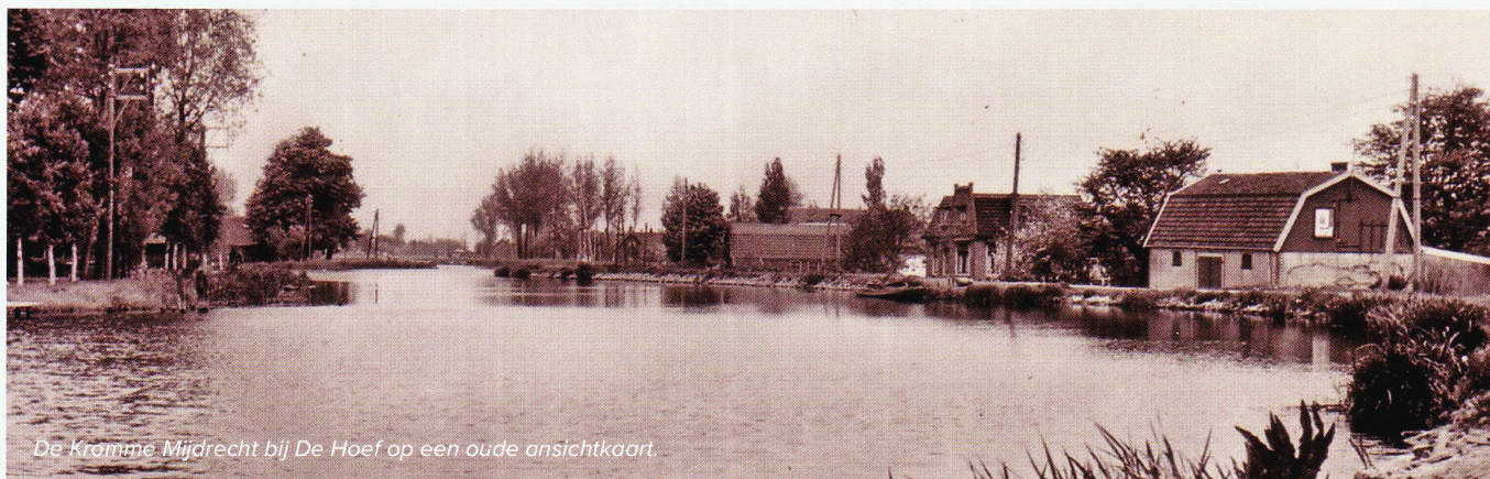
De Kromme Mijdrecht bij De Hoef op een oude ansichtkaart.

van dat water woonden, waren onderdanen van de Proosdij en hoorden bij Mijdrecht. Pas in 1731 ontstaat er wat duidelijkheid over de naam ‘De Hoef’. Een notariële acte uit dat jaar omschrijft de woonplaats van een betrokkene als wonende “ aen de hoeff Cromme Mijdrecht ”. De kade langs de rivier maakt daar een knik in de vorm van een paardenhoef, reden voor de