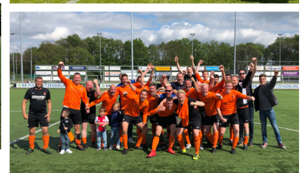
Deze pagina onder de groepsfoto van linksboven met de klok mee: J019-3, M015-1, M019-1, HHC 11, HHC 3, HHC 11 en J017-5!