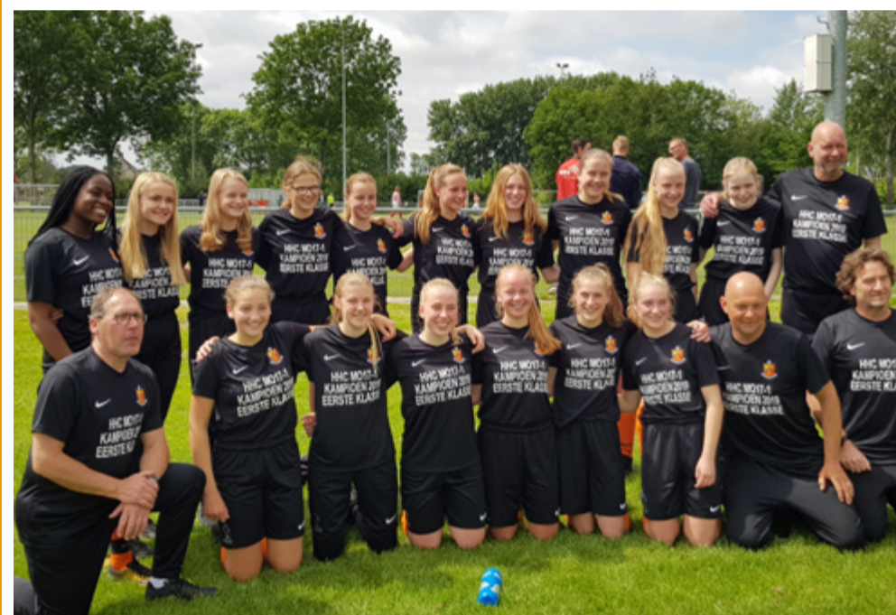
M017-1 Kampioen Voorjaarscompetitie

Voor het eerst is een HHC seniorenteam gelukt om de beker te winnen. Het team van De Zweef 4 werd hiervoor verslagen met 3-1. Een knappe prestatie van dit jonge team oranjehemden.