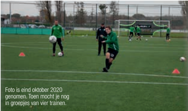
Foto is eind oktober 2020 genomen. Toen mocht je nog in groepjes van vier trainen.

De velden zijn verlaten, de kantines leeg. Het coronavirus heeft Nederland in z'n greep. Jammer want HBOK 1 was net lekker op dreef. Wat doen onze mannen om bij de les te blijven?