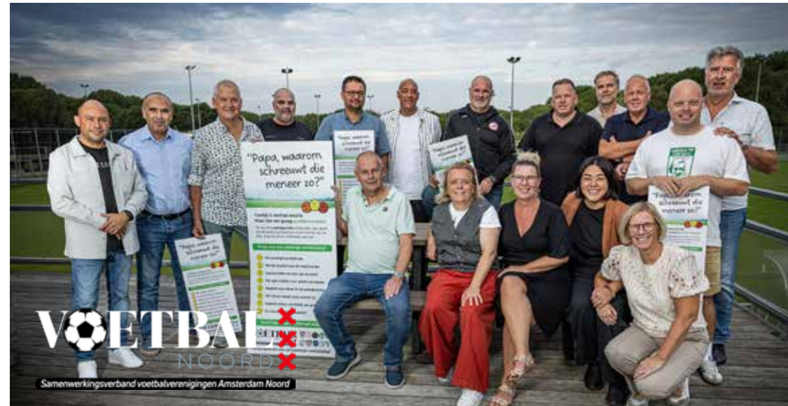
De deelnemende verenigingen uit Amsterdam Noord, verenigd in Voetbal Noord.