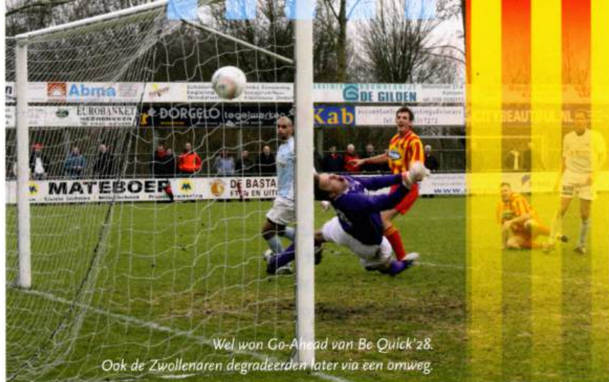
Wel won Go-Ahead van Be Quick'28. Ook de Zwollenaren degradeerden later via een omweg.

Jurrian Zandbergen heeft in Nunspeet de 500ste rood gele treffer op het hoogste niveau gescoord. Een fase van de competitie waarin Go-Ahead even een opleving had.