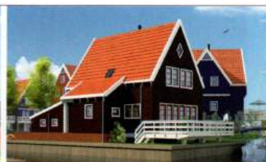
13 watergebonden woningen, 12 dijkwoningen en 8 rijwoningen Grafhorst