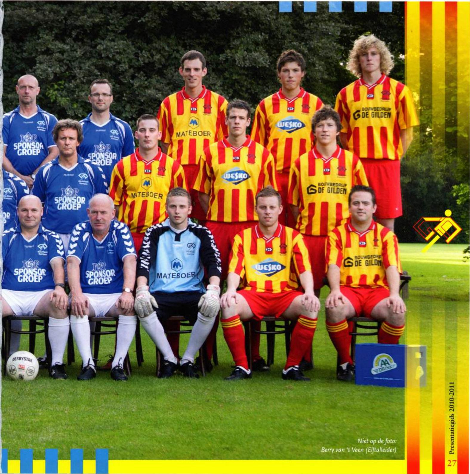
Niet op de foto: Berry van 't Veen (Elftalleider)