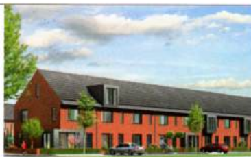
15 rijwoningen Stadshagen